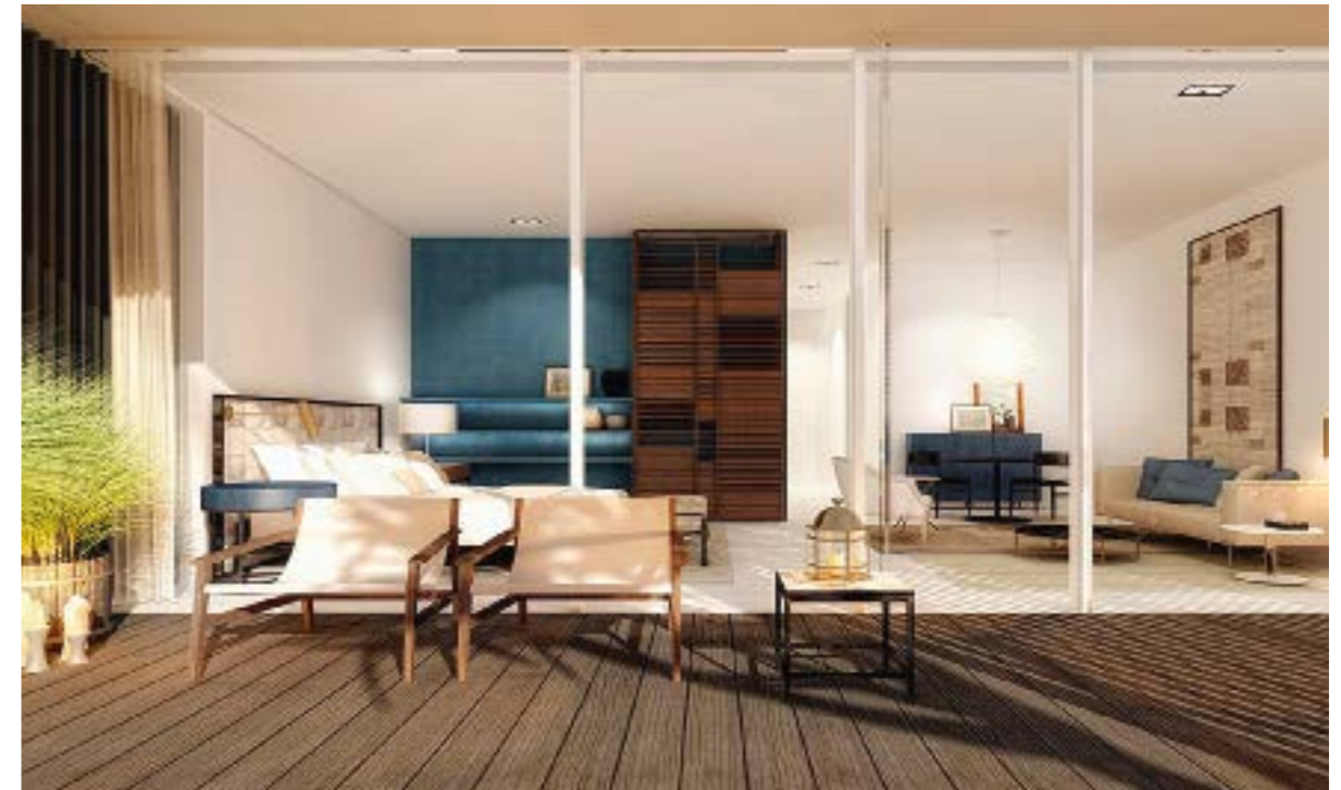
THE OBEROI BEACH RESORT, AL ZORAH Где находится: АДЖМАН, ОАЭ Дата открытия: ФЕВРАЛЬ 2017 ГОДА

Помимо консьержа и батлера, тайских и индийских терапевтов, известных шеф-поваров в новом отеле The Oberoi Beach Resort на побережье Адждмана на службе состоит астролог, составляющий персональный гороскоп гостям, фокусник, дающий магические представления, историк, читающий лекции о подвигах династии раджпутов, и травник, посвящающий в тонкости индийских и местных специй. В остальном новый курорт на берегу Персидского залива с пляжем белого песка, обрамленным мангровыми зарослями, полностью соответствует традиционным высоким стандартам роскоши Эмиратов. 113 вилл с бассейнами и номеров дорого обставлены, в спа предлагают уникальные процедуры, а также ритуал для двоих продолжительностью один день.