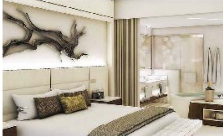
ROYALTON NEGRIL RESORT & SPA Где находится: НЕГРИЛ, ЯМАЙКА Дата открытия: январь 2017 ГОДА

Royalton Negril Resort & Spa можно назвать карибской классикой в инновационном исполнении. Комплекс с пляжем белого кораллового песка, изумрудной водой океана и веселыми барменами, напевающими за стойкой регги. Курорт Royalton Negril Resort & Spa разделен на три части, одна из которых, Hideaway , ориентирована только на взрослых. Здесь можно танцевать до утра и пить ром, медитировать с учителем йоги на собственном пляже, а также сказать друг другу «да» под сводом цветочной арки во время свадебной церемонии.