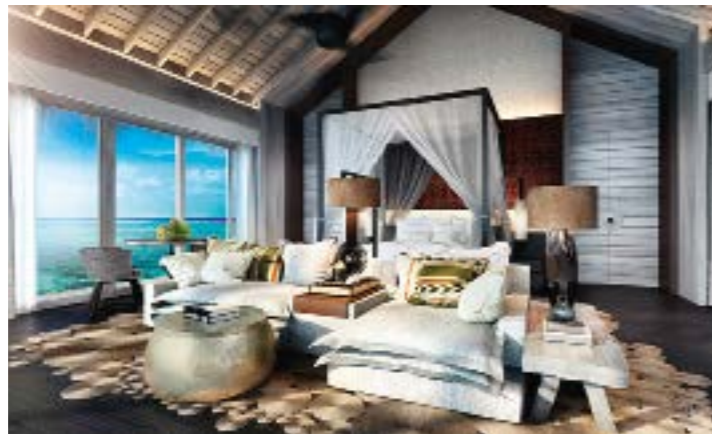
FOUR SEASONS PRIVATE ISLAND MALDIVES AT VOAVAH Где находится: АТОЛЛ БАА, МАЛЬДИВЫ Дата открытия: ДЕКАБРЬ 2016 ГОДА

Особые привилегии в отеле, такие как услуги персонального батлера, закрытый пляж, наиболее удобные номера и меню подушек, предлагают членам Diamond Club.