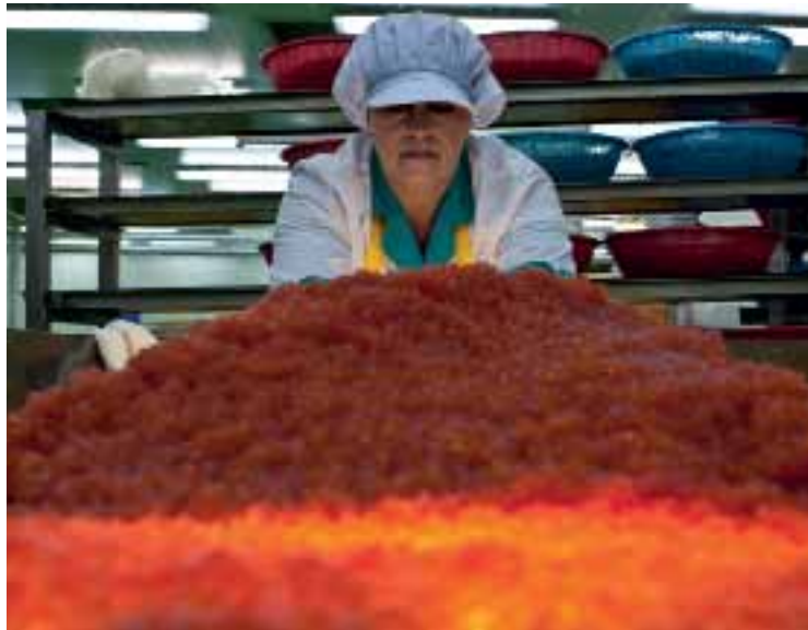
Икринка к икринке, немного соли, и вот оно — красное золото Сахалина

Нейминг на Итуруп — особенная часть путешествия. Услышав то или иное название, хочется немедленно его записать, чтобы не забыть. Бухта Золотая, озеро Красивое, озеро Лебединое, Ведмин лес, водопад Илья Муромец — все это романтика геологов. Аллегии местных жителей — Тещин язык, Пьяный мост, Сопун — даже не всегда нанесены на карту. Многие названия остались от айнов — коренных жителей островов. Например, оказавшись в бухте Оля, подозреваешь как минимум исторический адюльтер, состоявший между женатым капитаном и местной красавицей. Но по факту Оля, вернее Ойя, означает всего лишь лошадиное копыто, констатацию географического факта теми же айнами. В бухте Оля стоит