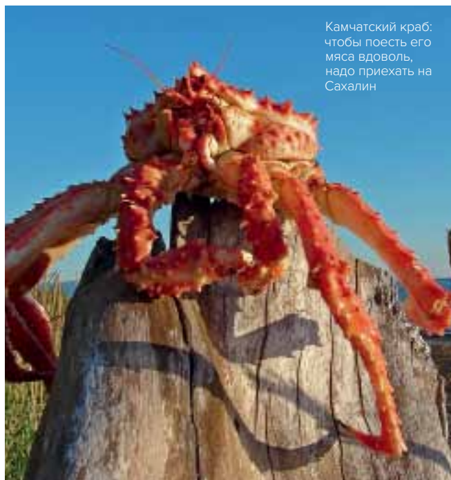
Камчатский краб: чтобы поесть его мяса вдоволь, надо приехать на Сахалин

На Итуруп можно попасть из Южно-Сахалинска двумя способами: на самолете и на пароходе. С 4 декабря 2016 года остров снят с режима погранзоны, и теперь никакого специального разрешения на его посещение оформлять не нужно. Для путешествия по Итурупу понадобится как минимум внедорожник, а еще лучше «вахтовка». Проще всего приобрести туры в мобильном приложении RocketGo, которое предлагает лучший выбор экскурсий и активных приключений не только на Курильских островах, но и на Сахалине.