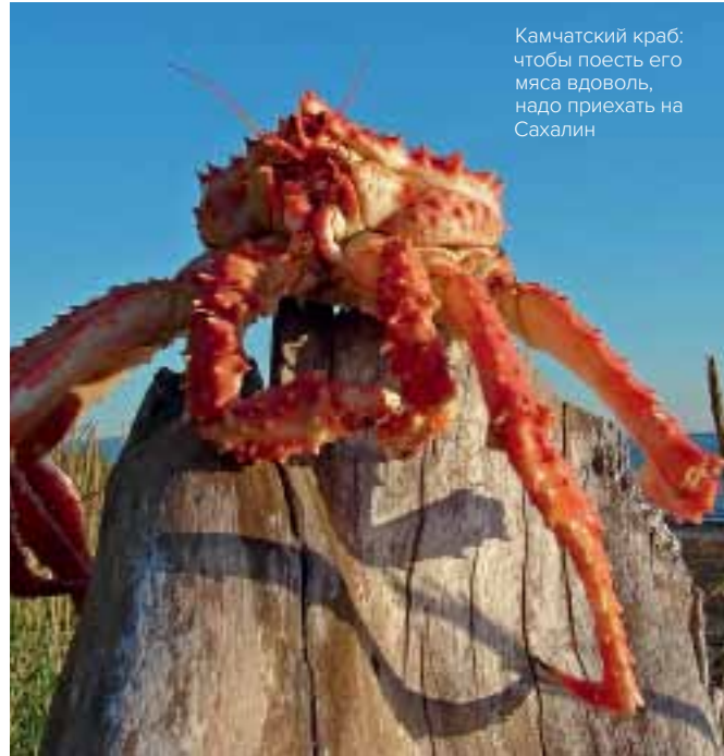
Камчатский краб: чтобы поесть его мяса вдоволь, надо приехать на Сахалин

На Итуруп можно попасть из Южно-Сахалинска двумя способами: на самолете и на пароходе. С 4 декабря 2016 года остров снят с режима погранзоны, и теперь никакого специального разрешения на его посещение оформлять не нужно. Для путешествия по Итурупу понадобится как минимум внедорожник, а еще лучше «вахтовка». Проще всего приобрести туры в мобильном приложении RocketGo, которое предлагает лучший выбор экскурсий и активных приключений не только на Курильских островах, но и на Сахалине.