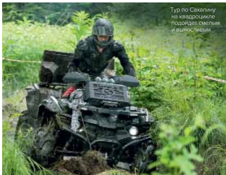
Тур по Сахалину на квадроцикле подойдет смелым и выносливым

Самое лучшее время для путешествий на Сахалин и соседние с ним острова — август и сентябрь, самый разгар дальневосточного лета