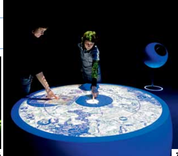
6, 7. Каждые полчаса в «Глобусе» демонстрируют шестиминутное захватывающее видео, рассказывающее историю нашей Вселенной и объясняющее, какие ее тайны хотят открыть физики с помощью коллайдера. Изучить работу коллайдера можно и самому, нажав кнопку «Старт» на большом интерактивном столе-дисплее в павильоне «Мистический мир»

В ЦЕРНе с момента его основания уже сделали массу важных открытий. Одно из них – буквально мимоходом. Например, здесь придумали интернет – исключительно для быстрого доступа к важным данным большого объема, о чем рассказывает скромная табличка на двери одного из офисов. Наверное, британец Тим Бернерс-Ли в далеком 1991 году и предположить не мог, что десятки лет спустя большая часть человечества будет использовать его изобретение только для того, чтобы ставить лайки и постить фотографии. Но таков уж побочный эффект.