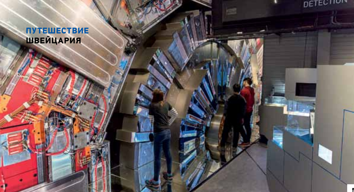
5. В музее «Микрокосм» среди прочего выставлена копия ATLAS – самого большого из четырех детекторов коллайдера, в которых происходят столкновения частиц. Это лишь часть конструкции, но в масштабе 1:1. Сам детектор высотой 46 м расположен в земле в специальной нише