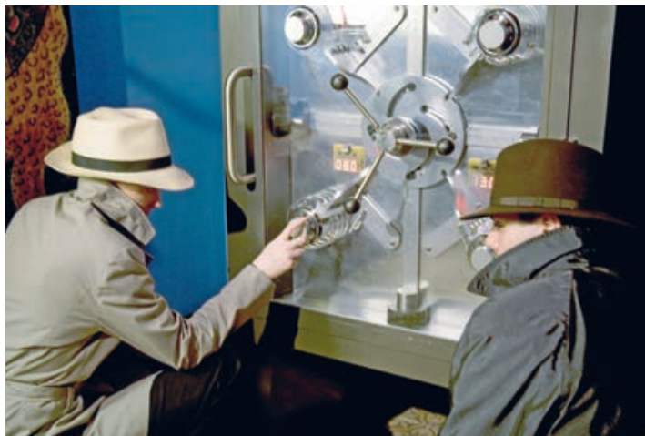
INTERNATIONAL SPY MUSEUM

охотно общается с гостями на японском и английском языках, поднимается по музейным лестницам и даже играет в футбол