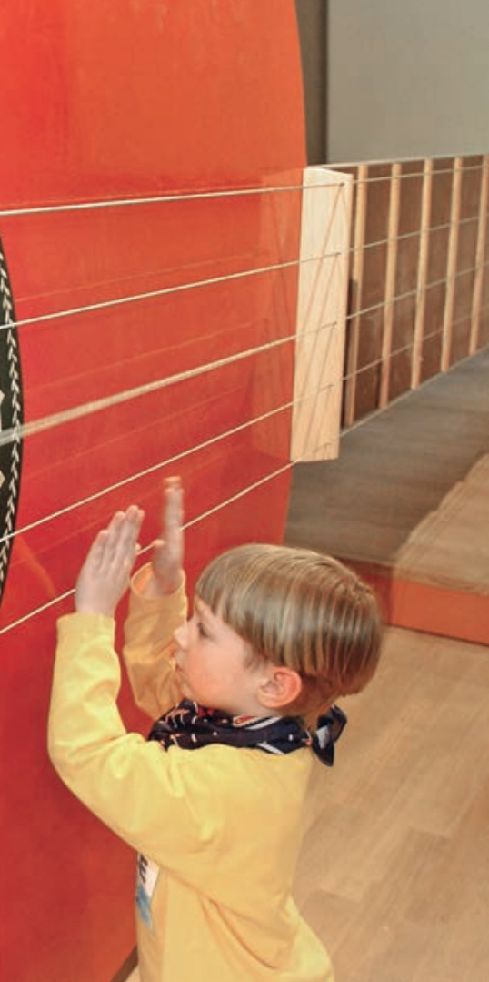
KLAS BRENNIGER / DEUTSCHEN MUSEUM