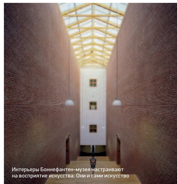
Интерьеры Bonnefanten-музея настраивают на восприятие искусства. Они и сами искусство

Маастрихт будит воспоминания. Об ушедшем, канувшем в Лету, — если любоваться рекой Маас со старинного, построенного римлянами, каменного моста Святого Сервация. О летних днях у бабушки — если лакомиться свежим абрикосовым флаем из местной пекарни, что у мельницы. О книгах Ремарка, которыми некогда зачитывался, — слыша резкий привкус кальвадоса в нежном десерте из арт-кафе Eetsafe ceramique.