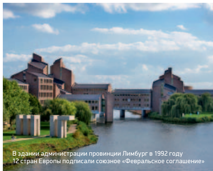
В здании администрации провинции Лимбург в 1992 году 12 стран Европы подписали союзное «Февральское соглашение»

с мольбами градоначальников Маастрихта «оставить все как было» привели к весьма неожиданному результату: старые городские здания, не поменяв своего внешнего облика, внутри превратились в объекты современного дизайна. Один из самых удачных примеров подобной эклектики – книжный магазин Selexuz. Архитекторы, работавшие над проектом, отнеслись с должным уважением к доминиканской церкви XVIII века,