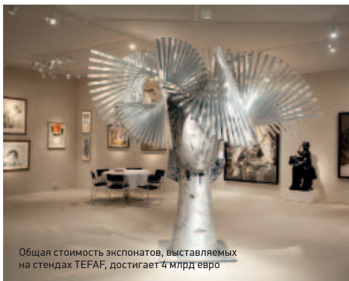
Общая стоимость экспонатов, выставляемых на стендах TEFAF, достигает 4 млрд евро