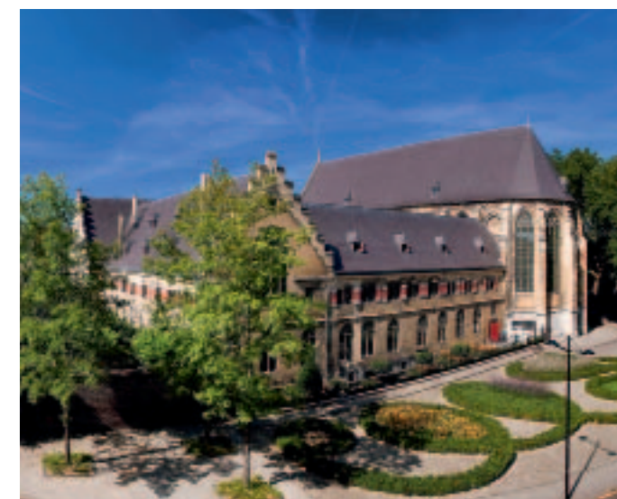
Kruissherenhotel — дизайнерский отель на 60 номеров. Внешне выглядит так же, как в XV веке, но внутри — XXI век

Во времена оны здесь обосновались рабочие местного керамического завода, прославившего Маастрихт на всю Европу... унитазами. Господа горшечники и керамисты устроили настоящий архитектурный хаос, отстраивая себе жилища вдоль реки. Делали это мастера сантехнической скульптуры не столь лапидарно и элегантно, но так настойчиво, что со временем район Керамик благодаря этой сумасбродной архитектуре домов приобрел своеобразный шарм. Мало того, он приобрел мировую известность, ибо за последние десятилетия был трансформирован руками, мыслями и проектами известных дизайнеров, включая Филиппа Старка. Новаторские архитектурные идеи вкупе