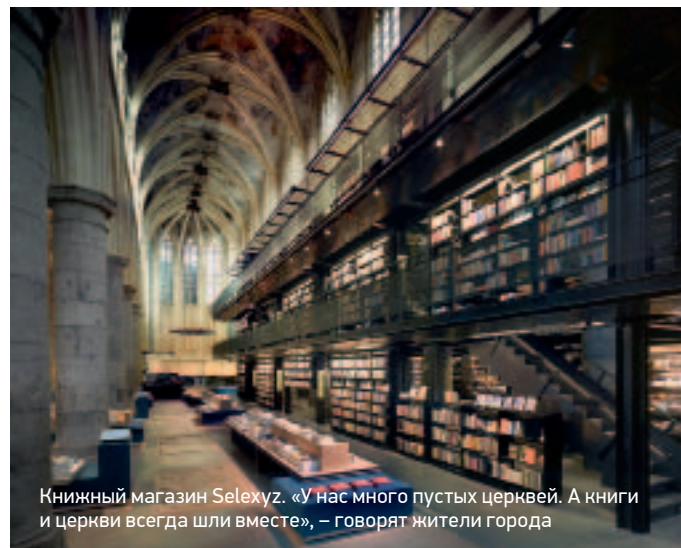
Книжный магазин Selexuz. «У нас много пустых церквей. А книги и церкви всегда шли вместе», – говорят жители города