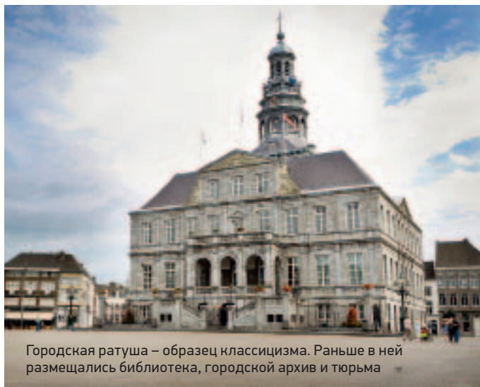
Городская ратуша – образец классицизма. Раньше в ней размещались библиотека, городской архив и тюрьма