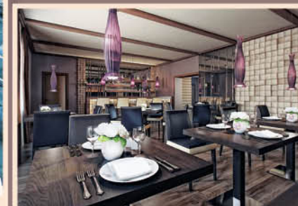
Сервис без компромиссов

ДВЕРИ «БАЙКАЛЬСКОЙ РЕЗИДЕНЦИИ» ОТКРЫТЫ ДЛЯ ВАС КРУГЛЫЙ ГОД!