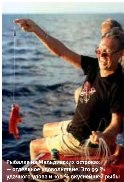
Рыбалка на Мальдивских островах — отдельное удовольствие. Это 99 % удачного улова и 100 % вкуснейшей рыбы