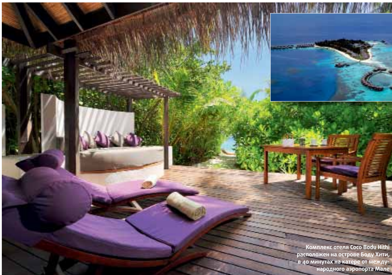
Комплекс отеля Coco Bodu Hithi расположен на острове Боду Хити, в 40 минутах на катере от международного аэропорта Мале

Мальдивы могли бы стать настоящим кошмаром Робинзона, попади он на один из 1192 островов: в какую сторону ни шагай — уткнешься в океан. Нет ни пресной воды, ни рек, ни озер, ни пещер, ни вкусных плодов, висящих над головой. Любой кусочек суши можно обойти неспешным шагом минут за пятнадцать. Куда ни кинуть взгляд — кругом вода. Она занимает 99 % территории страны — изумрудная у белоснежных берегов и цвета индиго в большом водном пространстве. Самый завораживающий вид на атоллы открывается сверху — кажется, что Всевышний, увлекшись морскими пейзажами, выронил из кармана охапку жемчуга. Но то, что не понравилось бы бедолаге, попавшему на необитаемый остров не по своей воле, пришлось по вкусу тысячам гостей, готовым с легкостью поменять огромные города на абсолютное уединение у океана.