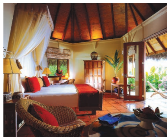
Курорт Coco Palm Dhuni Kolu, вилла Sunset Lagoon.

левой» (ногой капитана) она станет любимым средством передвижения гостей курорта. На дони они будут кататься на закате и любоваться дельфинами, с ее борта кидать наживку на рыбалке, на ней же будут отправляться на дайвинг и снорклинг, на экскурсию на соседний остров, где живут коренные мальдивчанцы. Из 1192 Мальдивских островов, заселены всего пара сотен, половина из которых представляет собой роскошные курорты с дорогими вилами. Отдых на одном из таких островков – тот самый getaway, побег на край света за счастьем медового месяца. Красивые закаты, теплая, изумрудная вода Индийского океана, уютные постели, белый