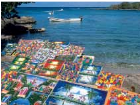
СВЕРХУ ВНИЗ: конные прогулки среди высоких пальм — приятная альтернатива пляжному отдыху; картины местных художников все как на подбор — яркие, как сама Доминикана