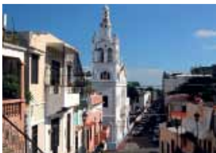
Сверху вниз: меренге, танец родом из Доминиканы, полон буйной энергии и не может никого оставить равнодушным; столица страны Санто-Доминго считается старейшей в Новом Свете