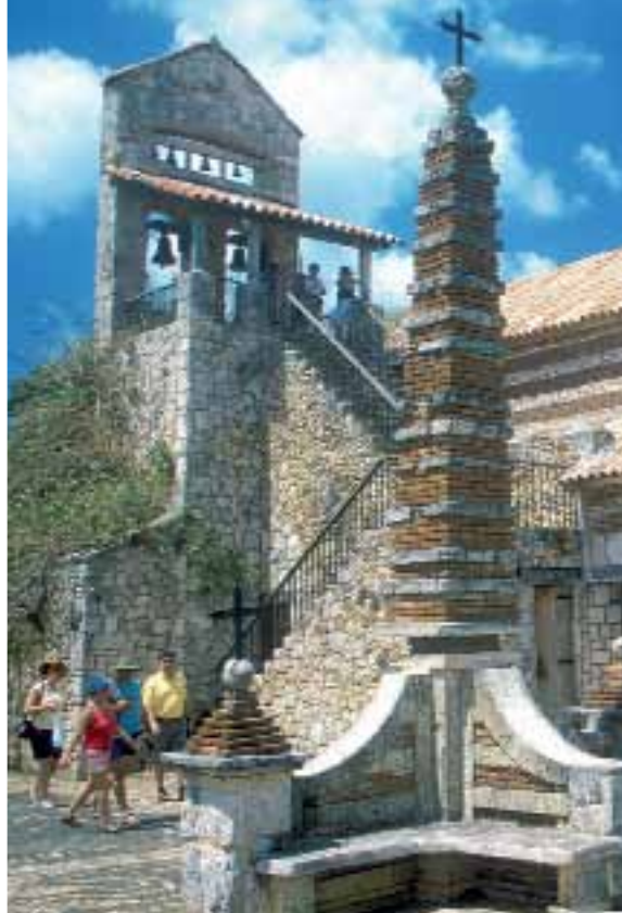
СЛЕВА НАПРАВО: с января по март в залив Саманы приплывают на зимовку горбатые киты; Альтос-де-Чавон — реплика испанской деревни XV века, называемой городом художников и ремесленников