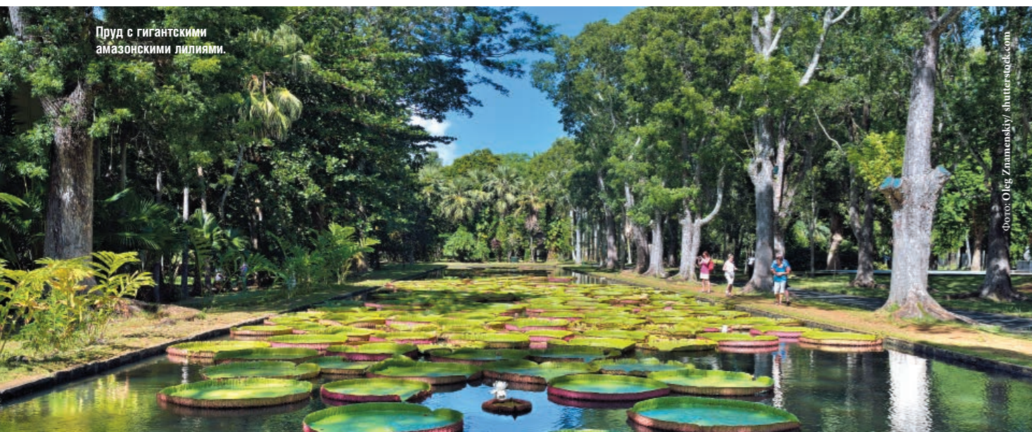
Пруд с гигантскими амазонскими лилиями.