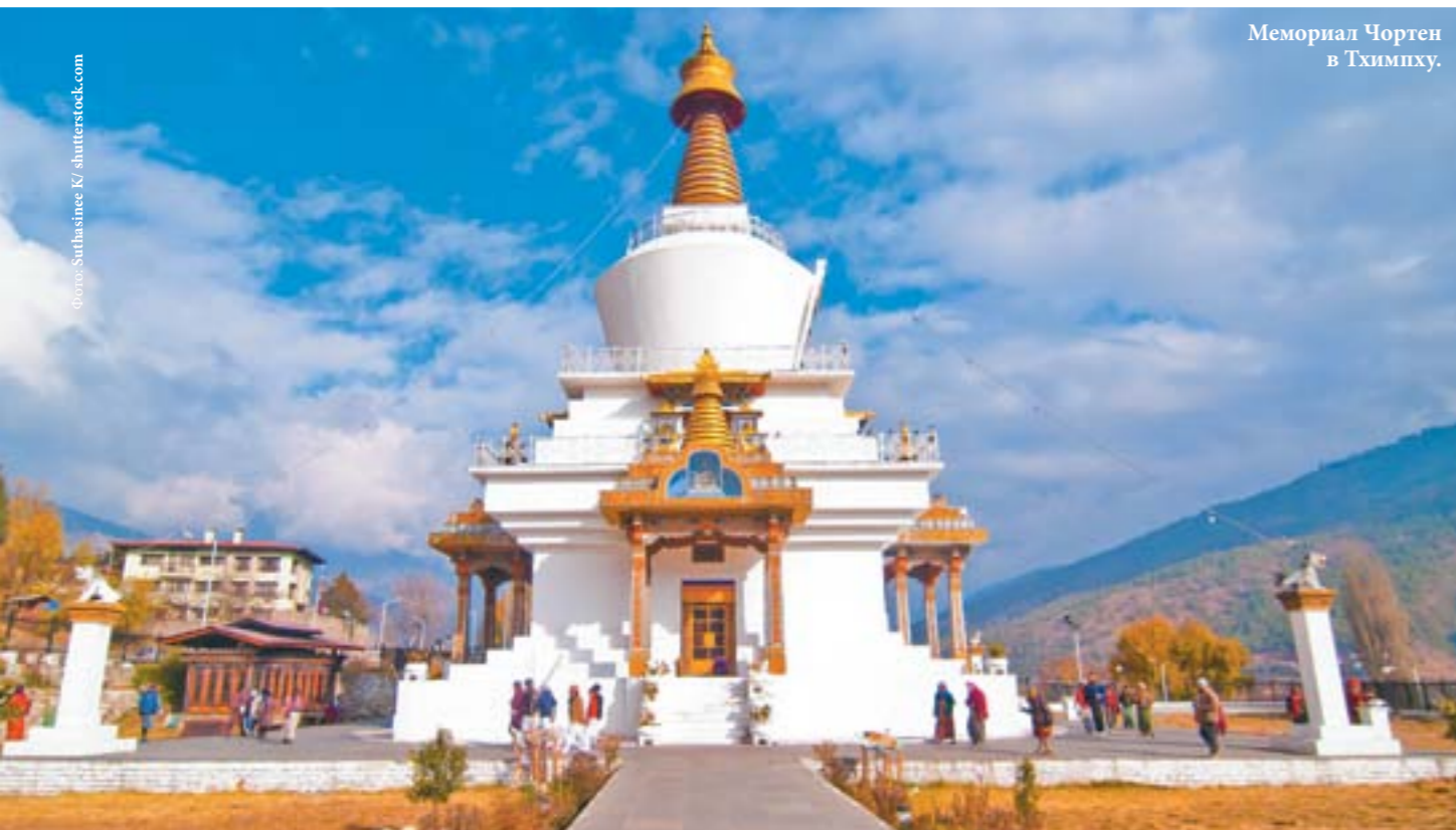
Мемориал Чортен в Тхимпху.