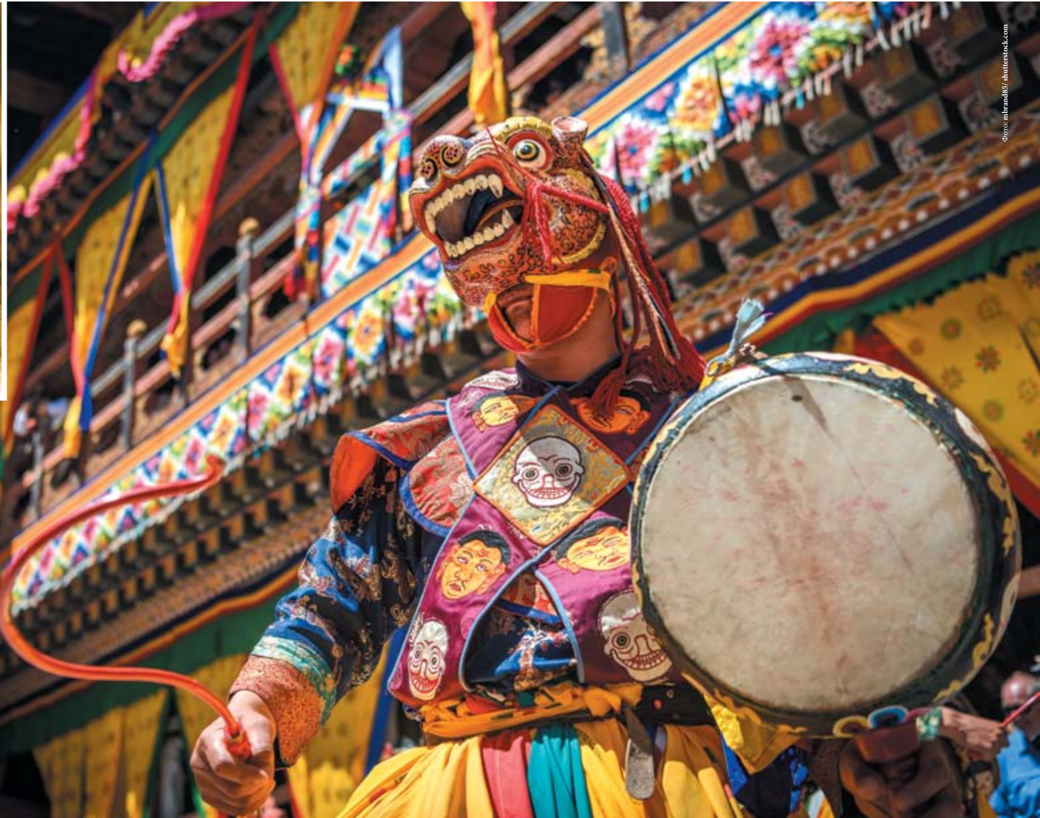
Буддистский монах исполняет танец цам.

Волонтерство и ночёвка на ферме – это бесценный опыт для адептов урбанизма. Пары дней в долине Паро достаточно, чтобы переосмыслить свои будни в цивилизации. Гостеприимные фермеры с радостью