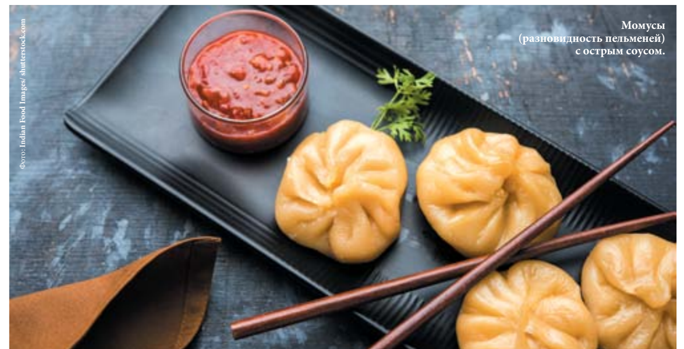
Момусы (разновидность пельменей) с острым соусом.

В Бутане все блюда подают с овощами – капустой, морковью, кабачками и, конечно, порцией липкого красного риса. Непременно попробуйте якбургер – массивный и сочный сэндвич с мясом яка. Стоит отметить, что мясо бутанцы едят редко, в основном по праздникам, но для туристов делают исключение – могут приготовить и курицу, и свинину, но обязательно с чили.