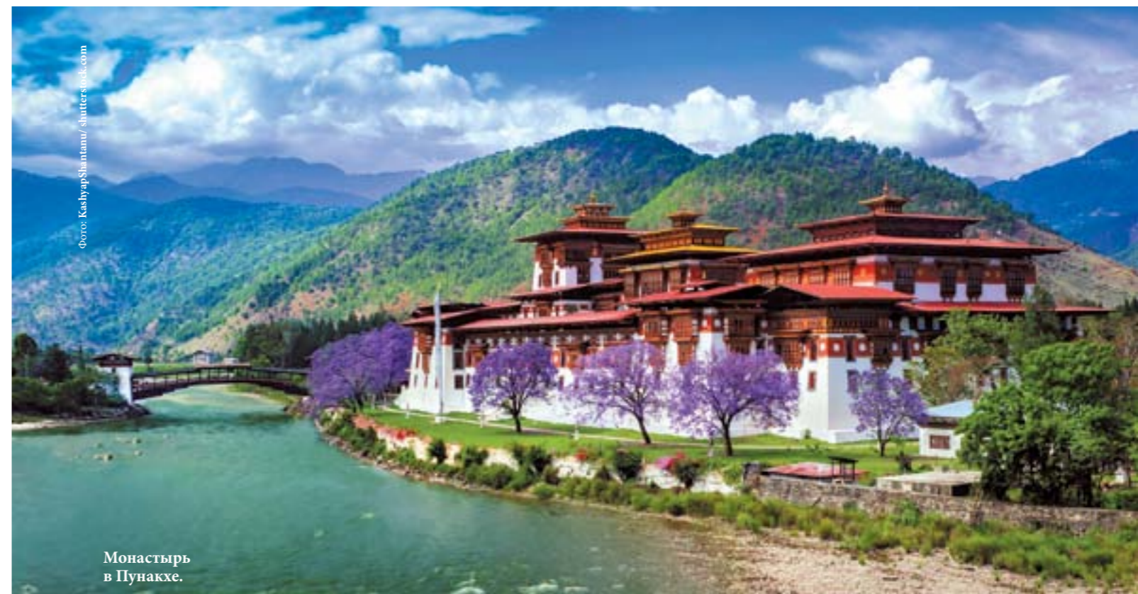
Монастырь в Пунакхе.

дворике можно увидеть юных монахов, рассмотреть в деталях уникальную архитектуру бутанских дзонгов, поговорить с настоятелем монастыря о важном, послушать его советы и рекомендации. В долине Пунакха непременно стоит прогуляться по подвесному мосту, украшенному молитвенными флажками, а также посетить комплекс Намгьял Чортен.