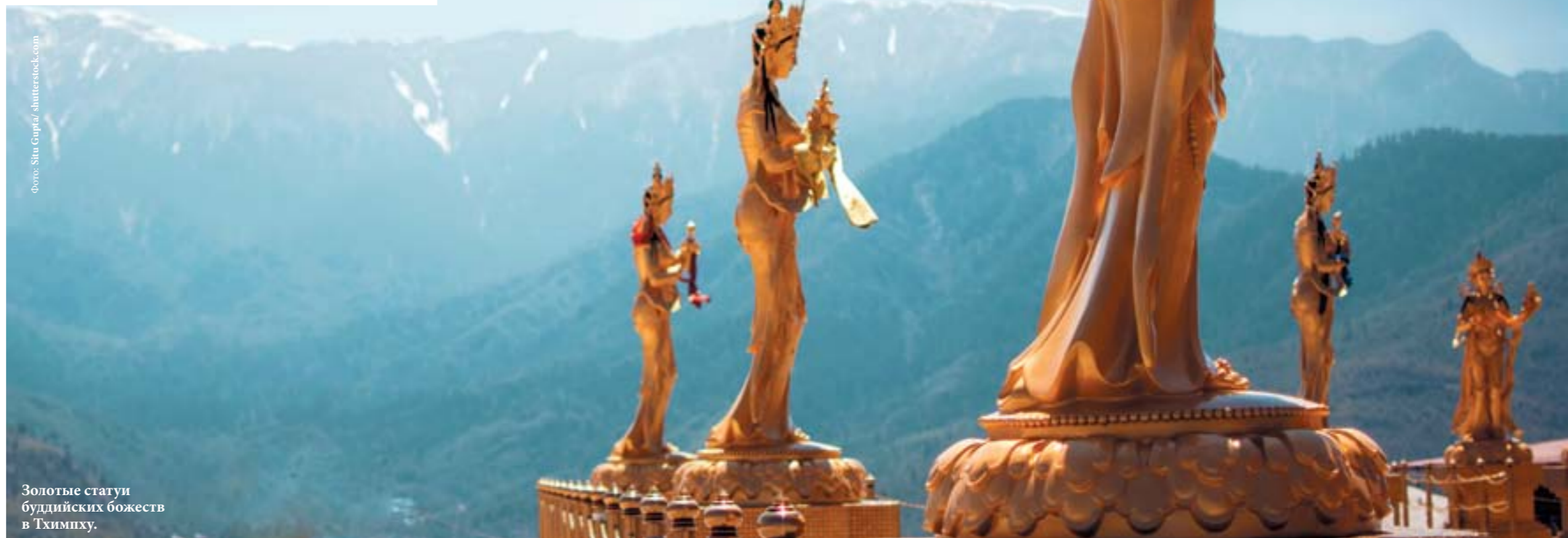
Золотые статуи буддийских божеств в Тхимпху.

Часть ценных экспонатов, да и само здание этот музей потерял во время землетрясения в 2009 г. Множество реликвий удалось спасти, в их числе – статуи Будды и Вишну, прочие древние раритеты, которые выставлены сегодня для просмотра, но