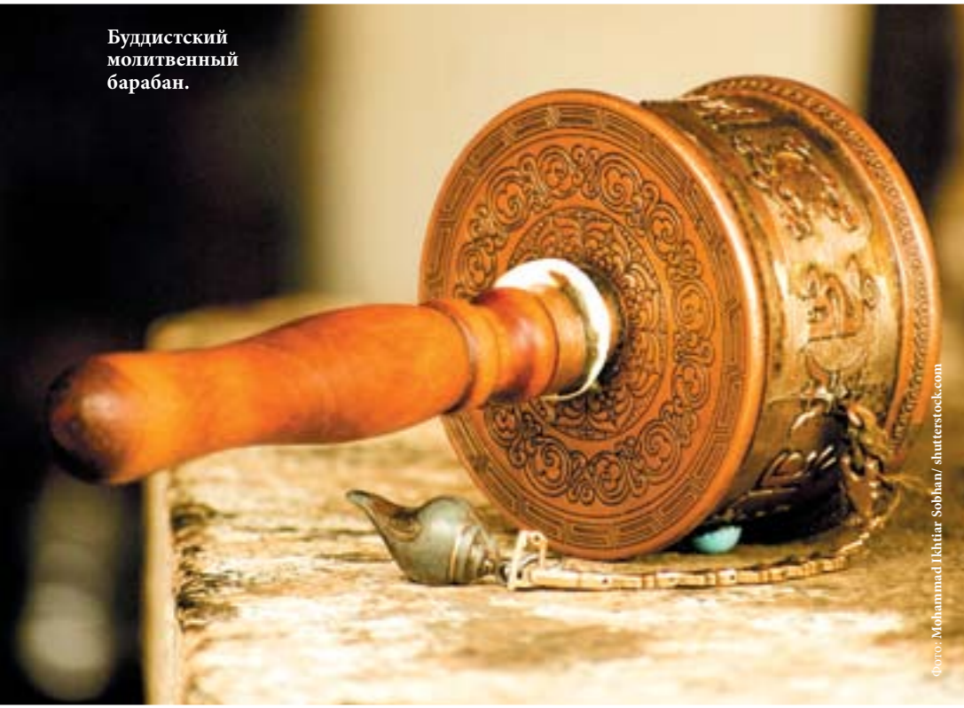
Буддистский молитвенный барабан.

какой-либо один не просто. Можно отправиться как на простую прогулку по реликтовым лесам, так и на самый сложный трекинг Snowman Trek почти через всю страну. Одна из самых популярных пеших троп – Джомолхари. Это трёхдневный маршрут, ведущий через национальный парк Джигме, девственные леса и высокие пастбища, на которых пасутся яки, мимо полей синих маков и древних дзонгов к стоянке Джамботханг, откуда открывается чарующий вид на священную одноимённую гору высотой 7 314 м. Пройти этим путём можно лишь с апреля по ноябрь. Ещё один популярный трек – Бумтханг, петляющий по деревенским дорогам мимо живописных храмов и монастырей. Бёрдвотчерам (орнитологам-любителям) понравится маршрут Gangte Trek, на котором можно понаблюдать за журавлями.