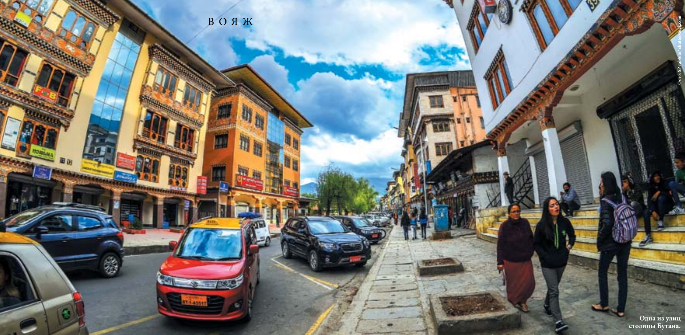
Одна из улиц столицы Бутана.

В Бутане действует запрет на продажу и употребление табачных изделий. Для туристов делают исключение, но с рядом условий.