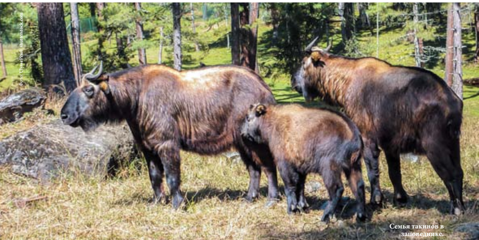
Семья такинов в заповеднике.

Ещё одно величественное сооружение, построенное у излучины двух рек, называется Дворец Счастья. Дорога к нему ведёт через перевал Дочу Ла. Монастырь в Пунакхе – один из старейших в стране. Как и многие другие дзонги, он не избежал наводнений, землетрясений и пожаров (выгорал почти дотла шесть раз). Когда-то здесь был коронован первый король Бутана. В монастыре хранятся мощи основателя обители – монаха Шабдรุงга. Во внутреннем