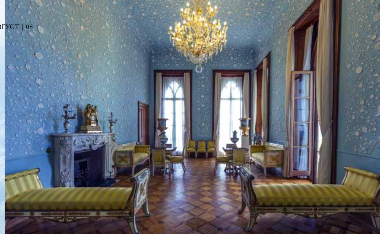
Голубая гостиная Воронцовского дворца

ВЕЛИЧЕСТВЕННОЕ ЗДАНИЕ НАПОМИНАЕТ ЗАГОРОДНЫЙ СРЕДНЕВЕКОВЫЙ ДВОРЕЦ XVI СТОЛЕТИЯ СТИЛЯ ТЮДОР С БАШНЯМИ, ОГРОМНЫМИ ЭРКЕРАМИ, АРКАМИ И КУПОЛАМИ