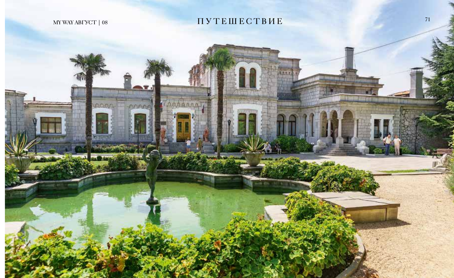
Фонтан перед фасадом Юсуповского дворца