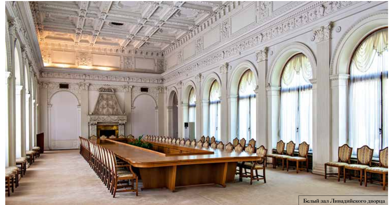
Белый зал Ливадийского дворца