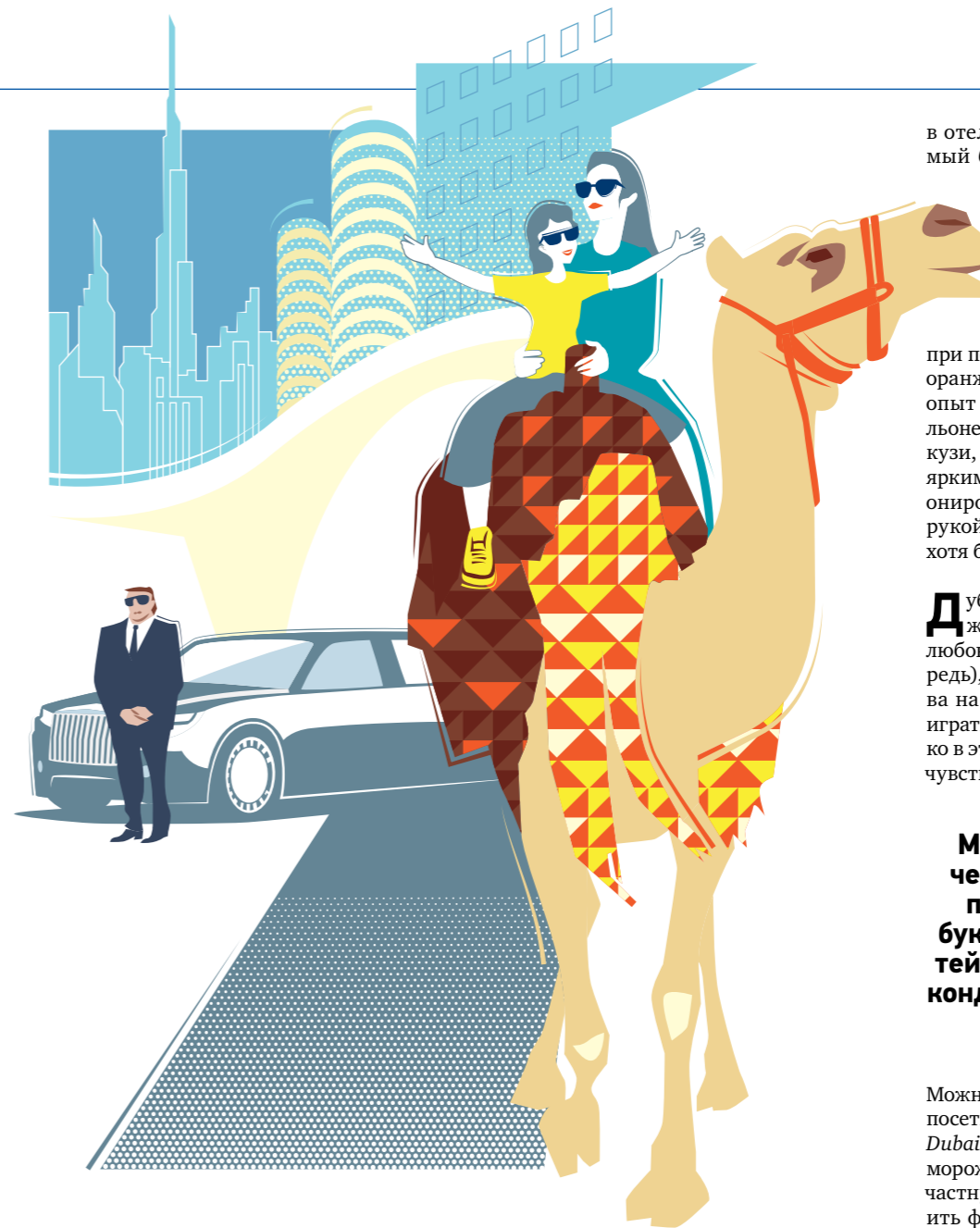
ИЛЛЮСТРАЦИЯ: ДМИТРИЙ ФИЛАТОВ

в отель, в парк аттракционов или в самый большой торговый центр на планете? К бассейну, сооруженному прямо в водах Персидского залива, привыкаешь быстро: в голубом резервуаре вода кажется прохладнее и создается ощущение, что плывешь в море с идеальной температурой. Но при погружении в бассейн, отделанный оранжевой мозаикой, получаешь новый опыт – кажется, что ты варишься в бульоне. А если перебраться в красное джакузи, ассоциации становятся еще более яркими. В итоге скрываешься в кондиционированном пляжном шале и машешь рукой официанту с просьбой освежить хотя бы бокалы.