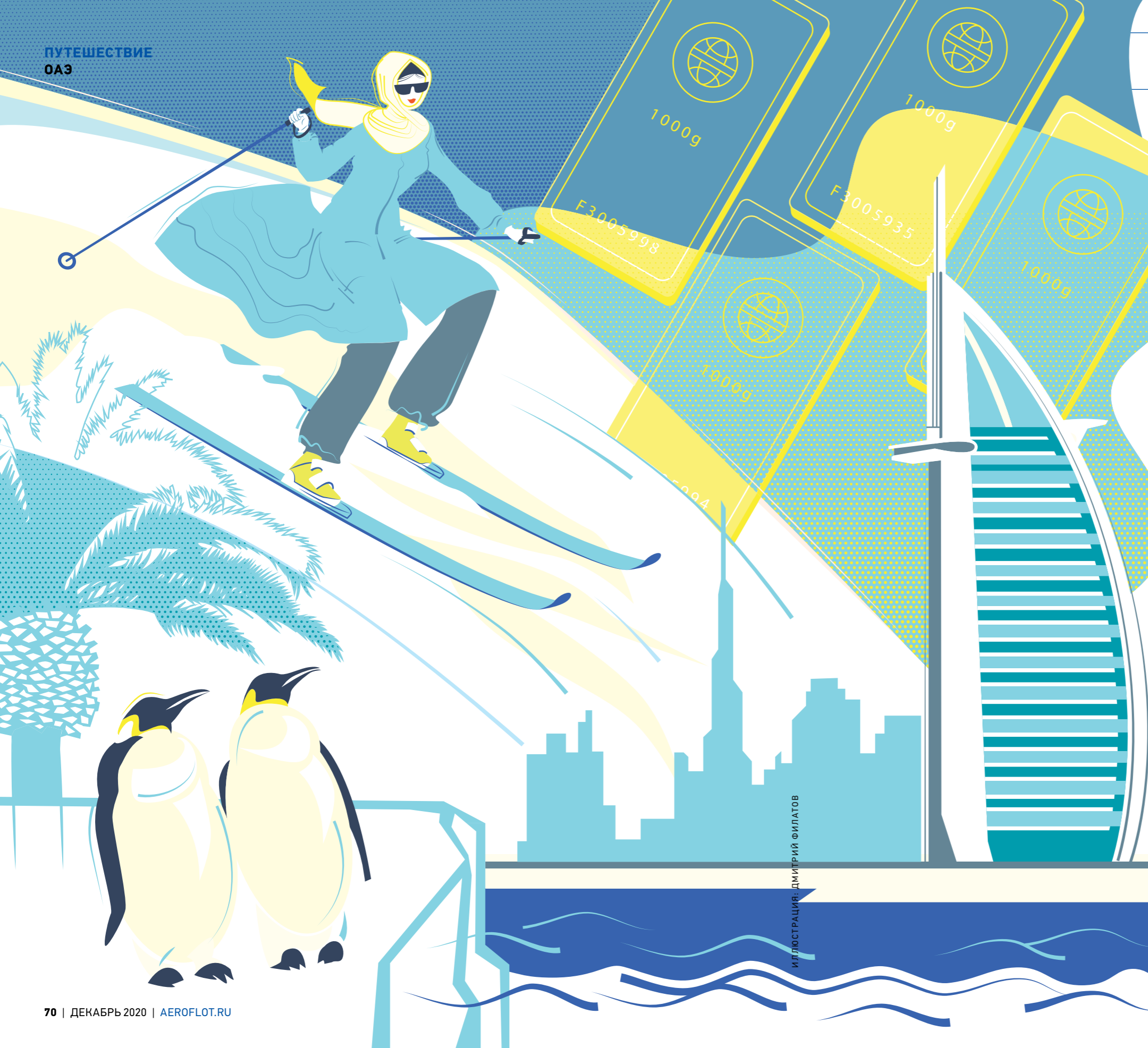
ИЛЛЮСТРАЦИЯ: ДМИТРИЙ ФИЛАТОВ