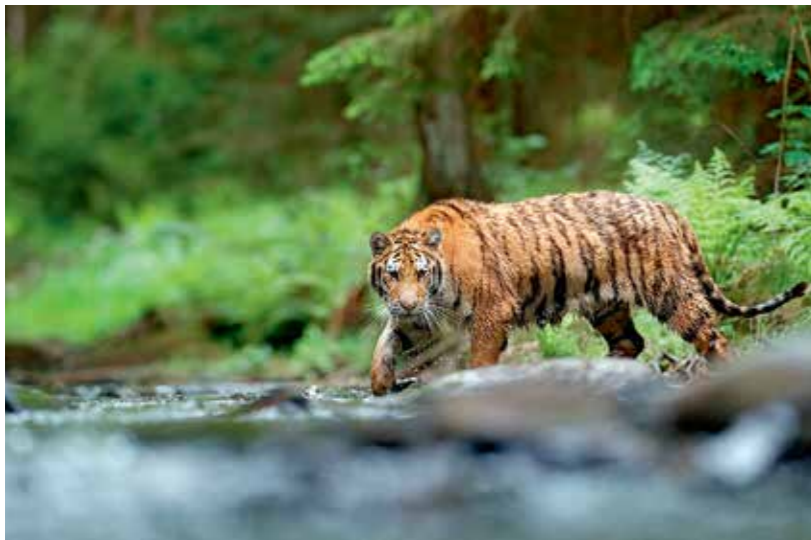
В дикой природе продолжительность жизни амурского тигра около 15 лет

в 18 км от Хабаровска. Она чуть ниже Змеиной, но панорамные виды на Амур и город ничуть не хуже, плюс у подножия есть небольшое озеро, на берегу которого удобно устроить пикник. Главное, принять меры предосторожности против клещей и таежного гнуса и запастись фальшфейером на случай встречи с медведем (и это не шутка).