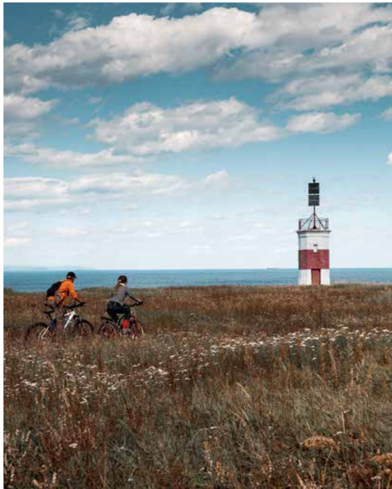
Маяк на берегу Охотского моря