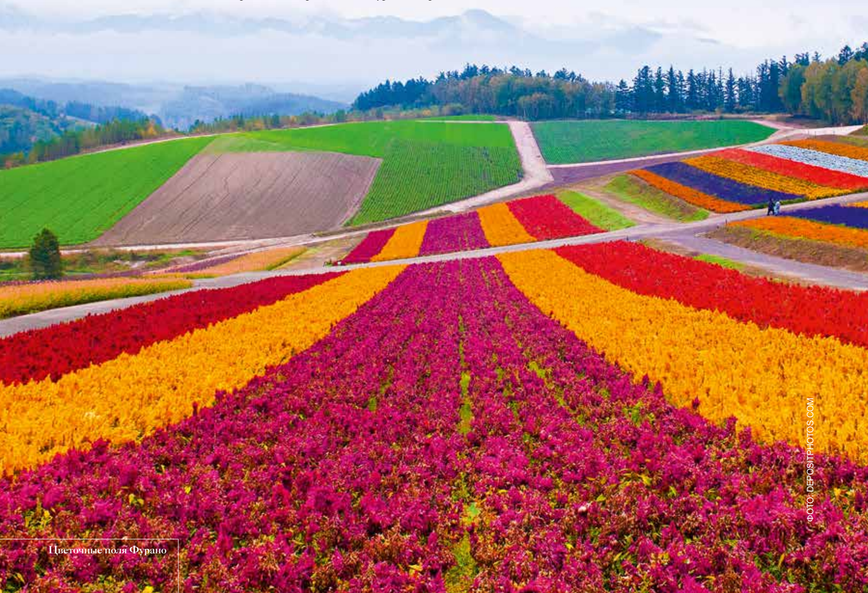
Цветочные поля Фурано

О легком помешательстве японцев от красоты цветущей сакуры и алеющих кленов слышаны все. А вот мысль о том, что насладиться очередным цветением можно в любой месяц года, приходит немногим. Волны цветочной эйфории так тщательно «спланированы» географически, что ради цветущих полей и деревьев отправиться в небольшой тур можно практически всегда. 350 деревьев глицинии зацветают в парке Асикага в префектуре Тотиги в начале мая. В это время года 150-летние деревья красиво подсвечиваются. А в конце весны холм Сибазакүра в префектуре Яманаси сплошь покрывается розовыми цветами флокса – или, как еще называют это растение, травяной сакуры. В городе Хитатинака, где