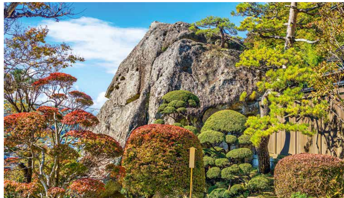
В лесах Ямагаты

Пройти путем древних пилигримов или забраться на священную гору – значит познать Японию именно такой, какой она была века назад, обрести внутренний покой и сделать массу культурных открытий. Пеших маршрутов по стране проложено множество, большинство отлично маркированы, оснащены аудиогuidaми и подробнейшими картами. Можно уйти в поход на уикенд, например в таинственные леса Ямагаты по Дэва Санзан или в древний буковый лес Якусимы, а можно – в длительное многодневное путешествие.