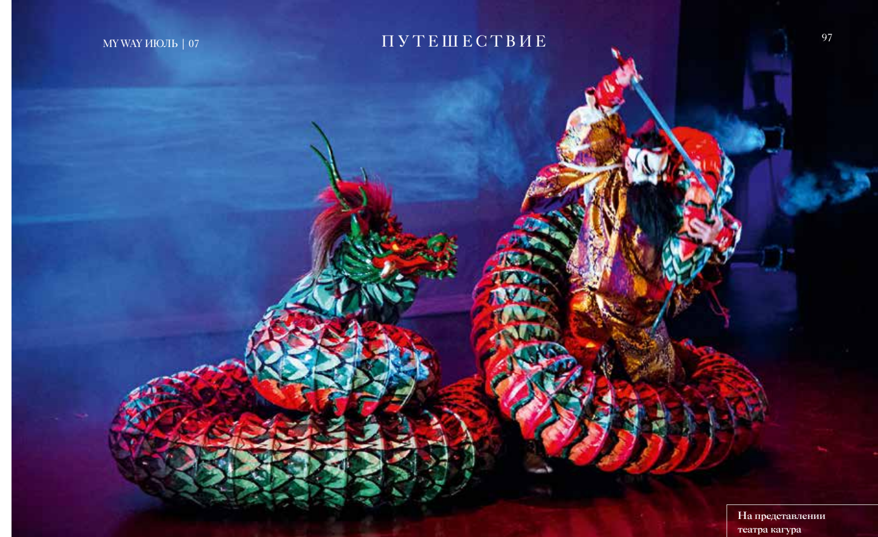
На представлении театра кагура

НЕКОГДА ЭТО БЫЛ ЭКСЦЕНТРИЧНЫЙ РИТУАЛ ПОКЛОНЕНИЯ БОГАМ СИНТО, КОТОРЫЙ СО ВРЕМЕНЕМ ТРАНСФОРМИРОВАЛСЯ В АУТЕНТИЧНЫЙ СПЕКТАКЛЬ ПОД МУЗЫКУ ФЛЕЙТЫ И БАРАБАНА