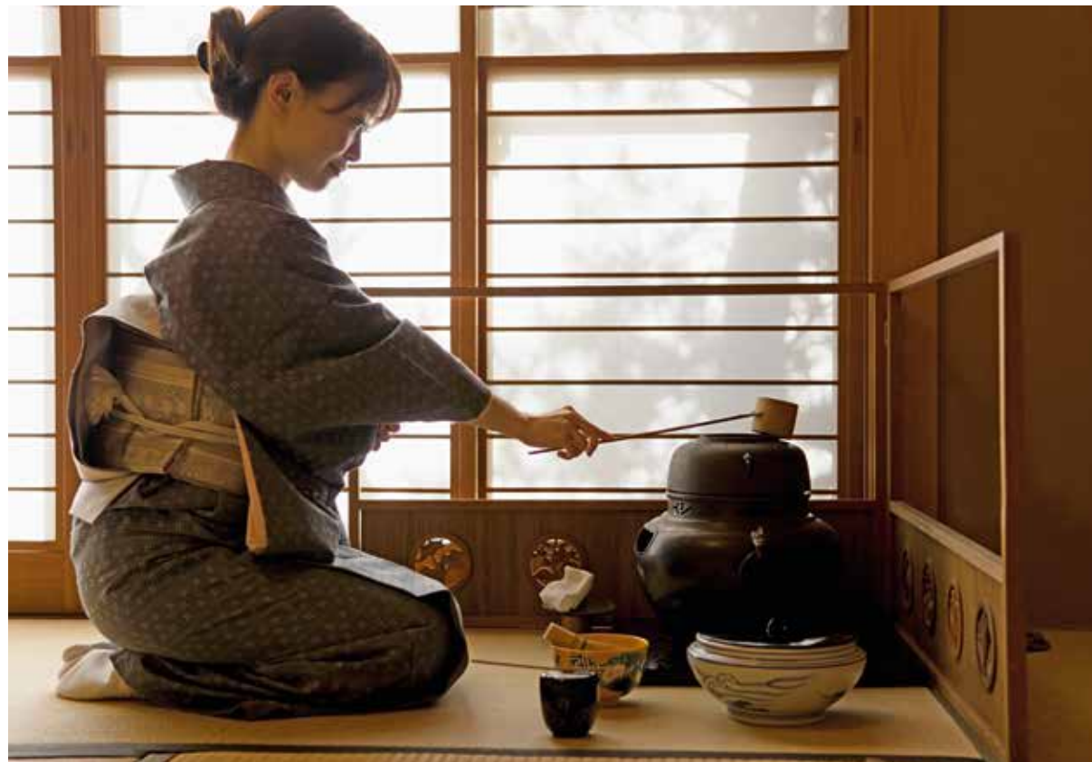
На чайной церемонии

в рёканах Киото, а приобщаться к чайной церемонии – в маленьком городке Удзи. Говядину из Кобе, о которой не понаслышке знают и на других континентах, разумеется, стоит пробовать именно в Кобе – лучшие стейки подают в Setsugetsuka. Но этими блюдами не удивишь гурманов из Европы, так почему не отважиться попробовать что-то особенное? Например, удон из пшеничной лапши на Сикоку, где находится почти 800 лапшичных. Также в Такамацу и Токусиме много ресторанов, имеющих сертификаты на разделку ядовитой рыбы фугу: один из самых известных – Нуакитога. Вкус у этого иглобрюха весьма специфический, и пробуют его, скорее, ради ярких переживаний. Говорят, крошечная доза яда может вызвать у вас ощущение эйфории, но даже пара лишних капель приведет к печальным последствиям. В действительности все не так фатально – сейчас фугу выращивают на фермах, где ей не позволяют есть донный мусор, превращающийся в токсичные молекулы тетродотоксина, который в 13 раз опаснее мышьяка. Да и повара целых полгода учатся правильно разделывать рыбу, чтобы получить вожделенный сертификат.