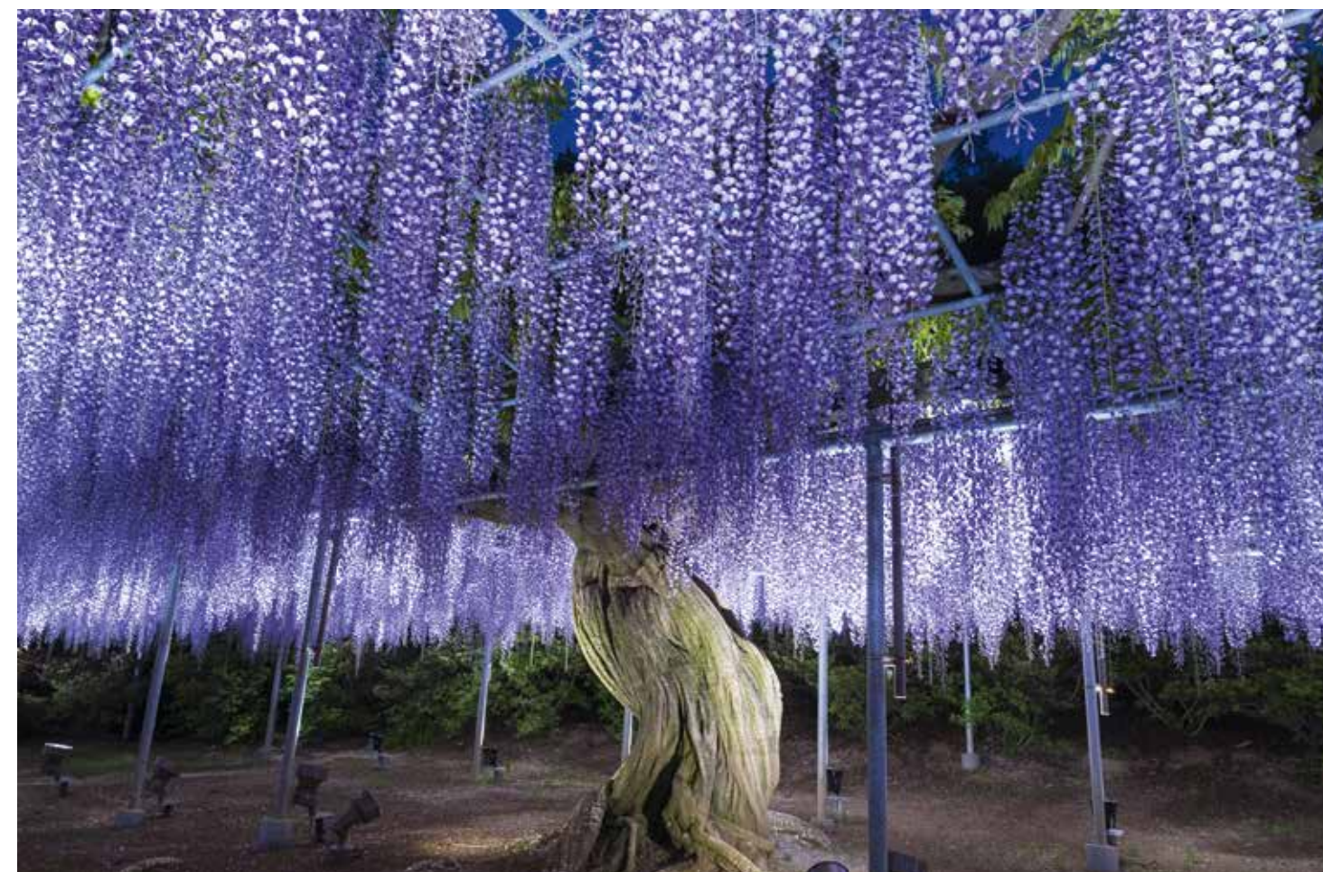
Цветущая глициния в парке Асикага

когда-то находилась американская военная база, в национальном парке Hitachi цветочные декорации меняются в соответствии с сезоном: весной здесь дружно распускаются 5 млн незабудок и немophil, летом алеют маки, а осенью правят бал кохии. В Японии есть и свои лавандовые поля – на Хоккайдо, ничуть не уступающие Провансу. Цветочная ферма Томита с июля по август проводит множество «лавандовых мероприятий» – от открытого производства масел до всевозможных мастер-классов. А поля Фурано летом окрашиваются в самые разные оттенки: цветут рапс, маки, люпины, лилии, подсолнухи, шалфей и космея.