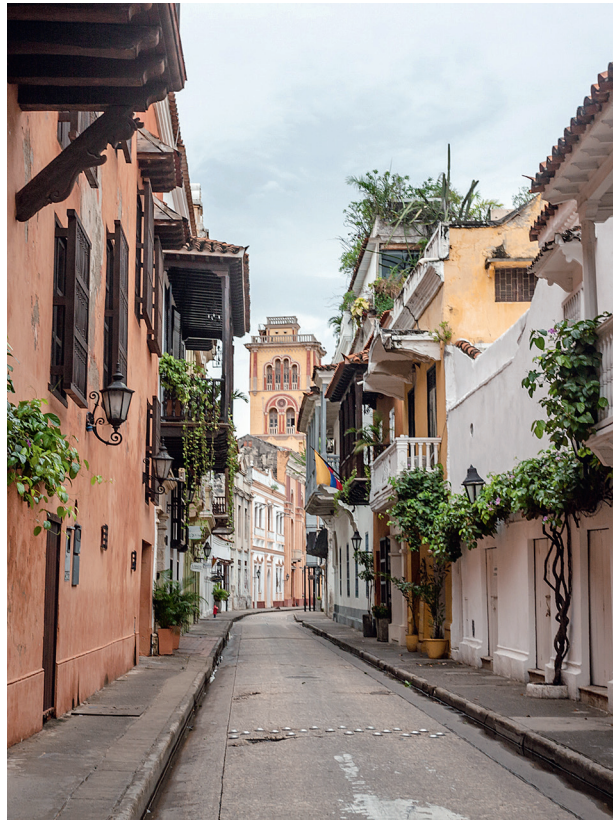
В старой Картахене у каждого особняка зеленеет лиана

Sasson, Andrés Carne de Res (последний похож скорее на клуб любителей бурлеска и сальсы).