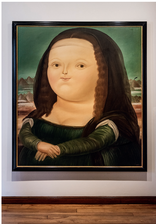
«Интерпретация Моны Лизы» Фернандо Ботеро