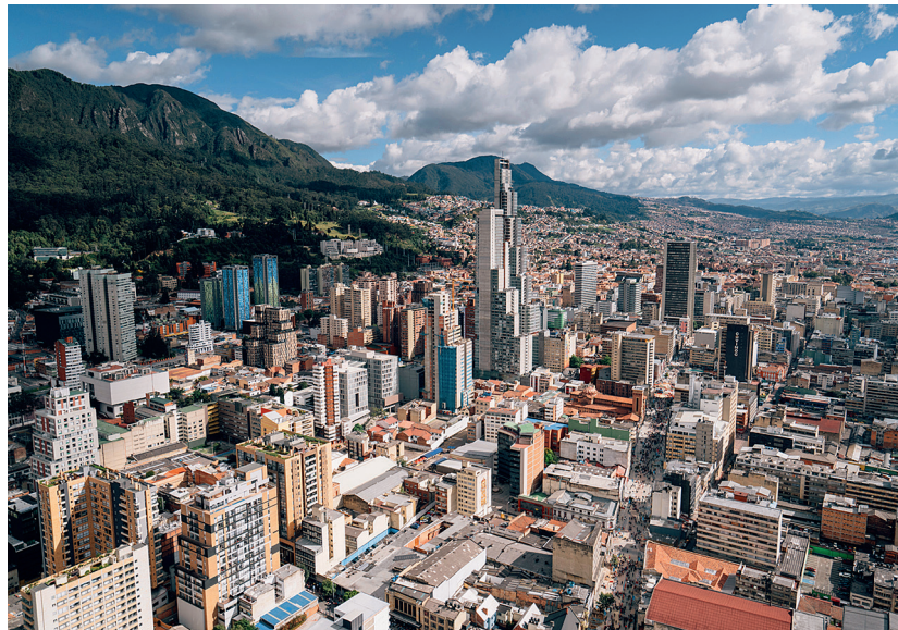
Богота лежит в зеленой долине на высокогорном плато Анд