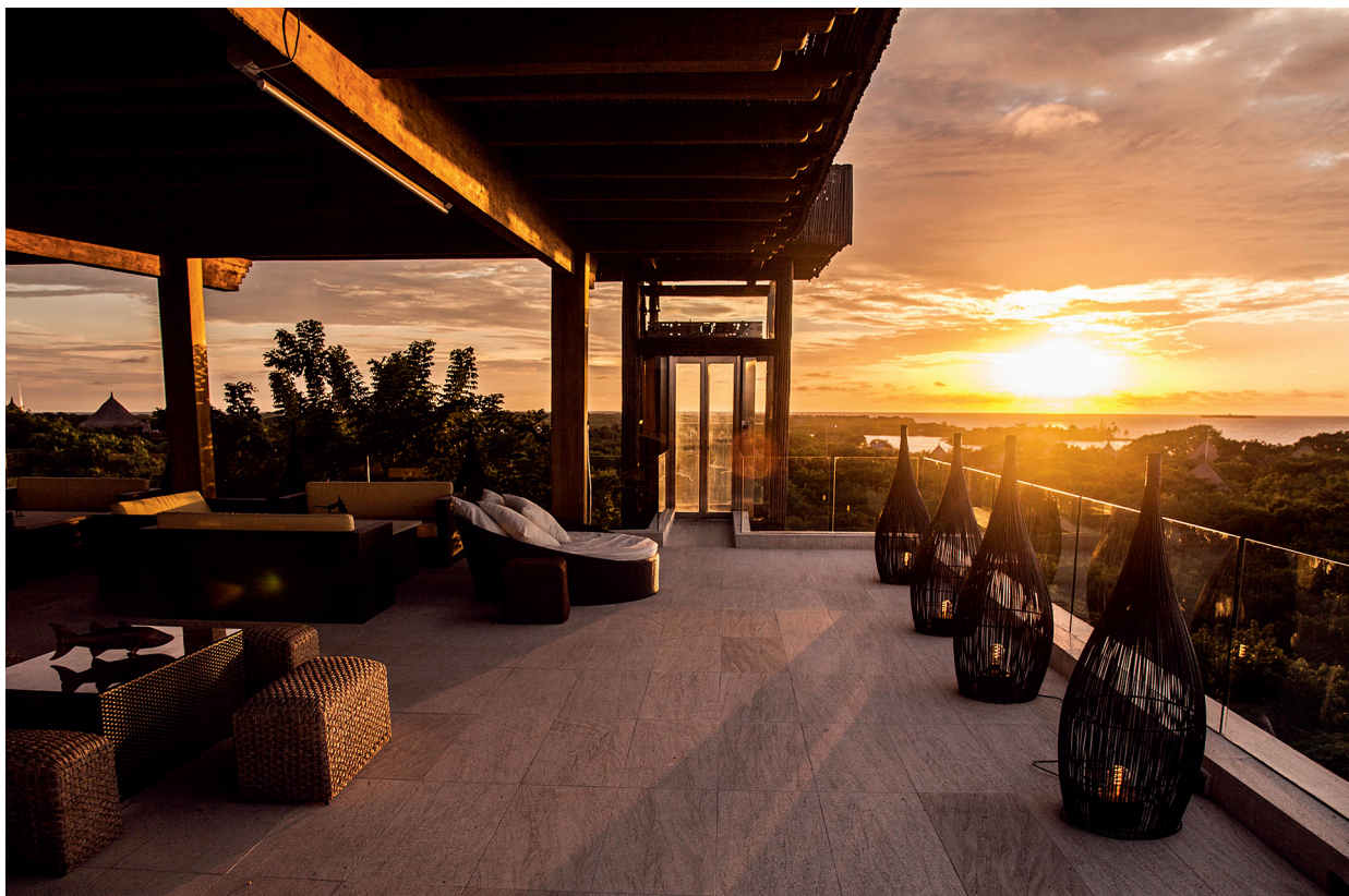
С террас отеля Las Islas, что переводится как «Острова», видны острова Гранде, дель-Пирата и Лисамар

творчеству Маркеса. Можно скачать и приложение для самостоятельного тура (оно называется La Cartagena de Gabo), но лучше пойти на «именную» гастрономическую прогулку от Foodies Colombia. Попробовать любимые блюда колумбийца, которого называли просто Габо, вспомнить строчки из его романов, прочувствовать атмосферу города — со стуком копыт по мостовой и хрустом льда в бокале мохито.