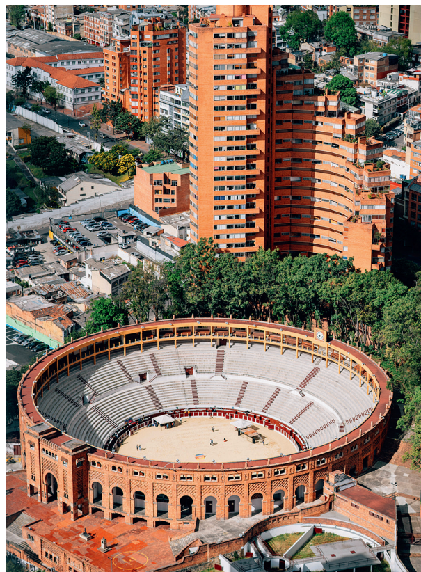
Арена Сантамария для корриды построена в Боготе в 1931 году

правителя муйска с озера Гуатавита, украшавшего себя золотой пылью во время ежедневных ритуальных церемоний. Плот со всеми фигурками был отлит как единое целое в промежутке между 1200 и 1500 годами до н. э. По тем временам золото было не дорогим, а священным металлом — символом солнца. А вот изумруды ценились всегда.