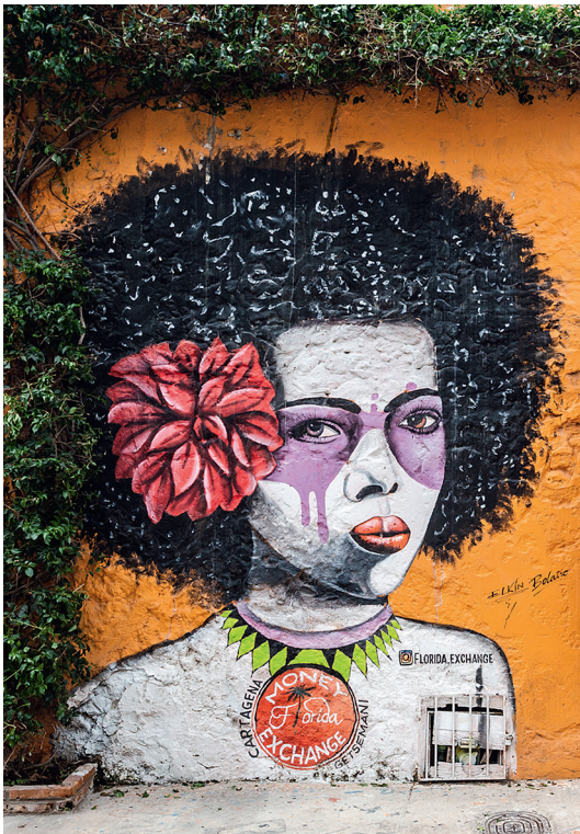
Граффити в картахенском квартале Хетсемани