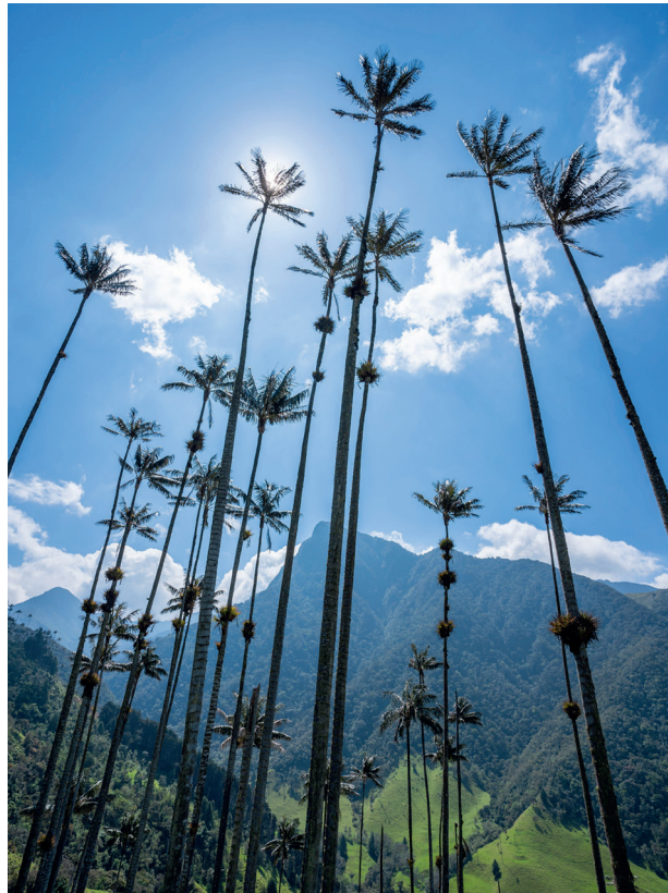
Восковые пальмы, самые высокие в мире, достигают 60 метров

Ужинать в Карфагене Индийском нужно с шиком — в Alma, Candé, Donjuán, La Vitrola. Попробовать суп из карибских омаров и жаренный на кокосовом молоке рис — его подают с рыбой на гриле и патаконес, лепешками из зеленых бананов. Провожать солнце за горизонт хорошо в Café del Mar на городской стене: к коктейлям подают розовое небо и парящих фрегатов.