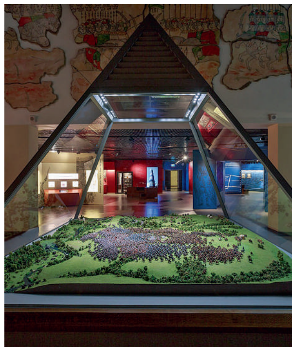
В одном из залов музея «Куликово поле»

Альтернативой станут пешая экскурсия с гидом по степи, вдоль села Монастырщина к реке Смолке, или велосипедный трек к месту слияния Дона и Непрядвы.