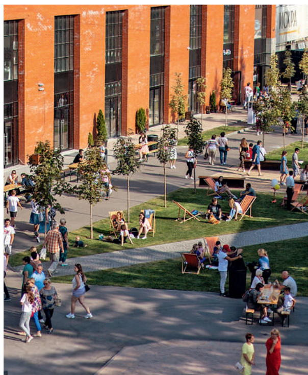
Пространство «Искра» существует с 2018 года