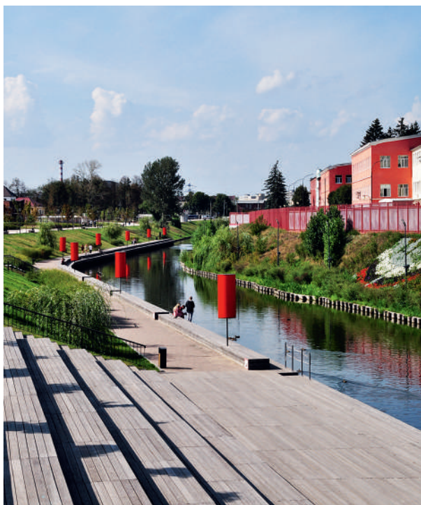
Набережная реки Упы

Одной стеной кремль выходит на Казанскую набережную, появившуюся в Туле всего несколько лет назад. Прогулочную зону обустроили по всем урбанистическим трендам – с ротондами, кофейными киосками, мостками для прогулки над рекой Упой, сценой, где проходят концерты. Набережная начинается от сквера