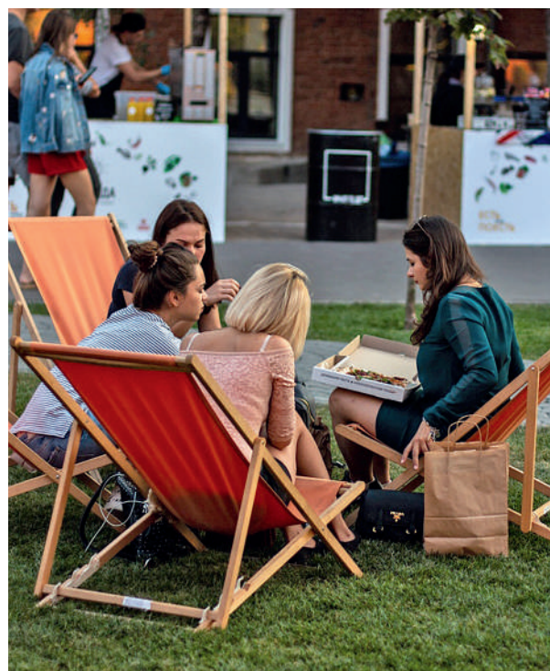
В «Искре» легко попасть на мастер-классы, пикники и другие мероприятия