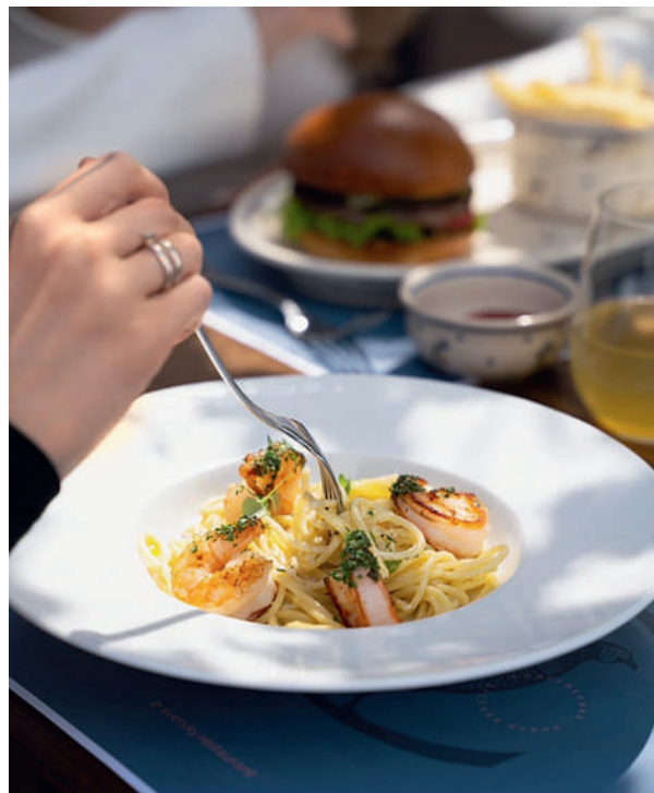
В меню ресторана «Светски» помимо русской кухни присутствует и классика международной