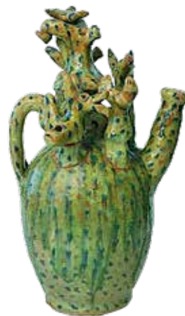
В экспозиции ташкентского Музея прикладного искусства представлены резьба по дереву, керамика, чеканка, золотощейные изделия, вышивка и росписи