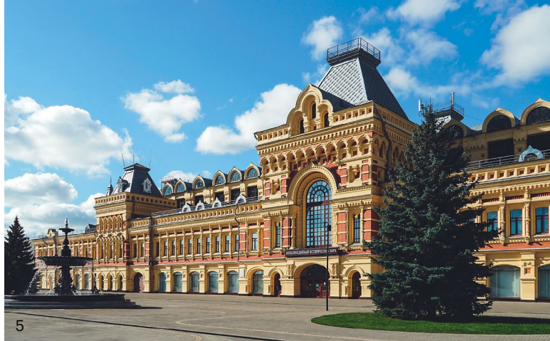
5 Когда-то это здание было Главным ярмарочным домом Нижегородской ярмарки

Реклама. АО «Авиакомпания «Россия»», 196210, Санкт-Петербург, ул. Пилотов, д. 18/4, ОГРН 1117847025284.