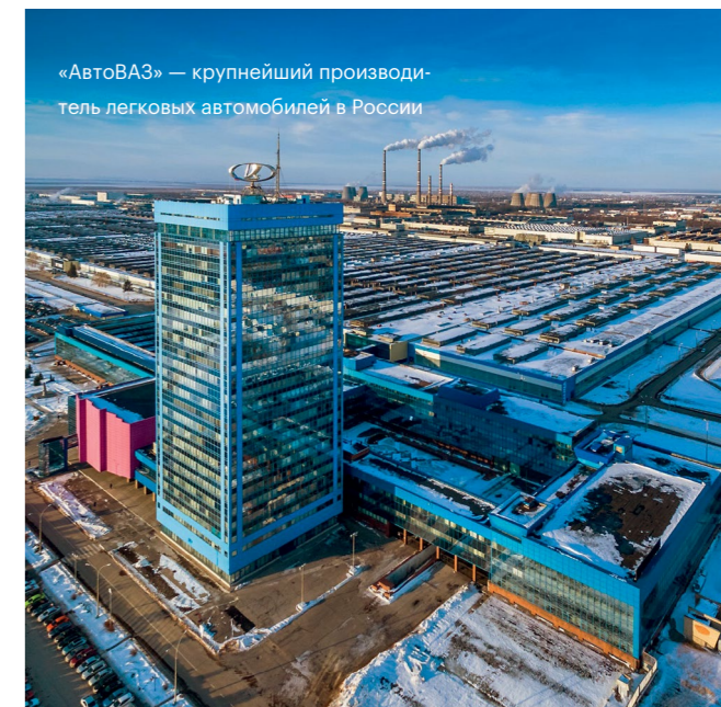
«АвтоВАЗ» — крупнейший производитель легковых автомобилей в России

Если же проголодаетесь, советуем перекусить вкуснейшими пирожками и чебуреками в кафе «У Антонины». ■