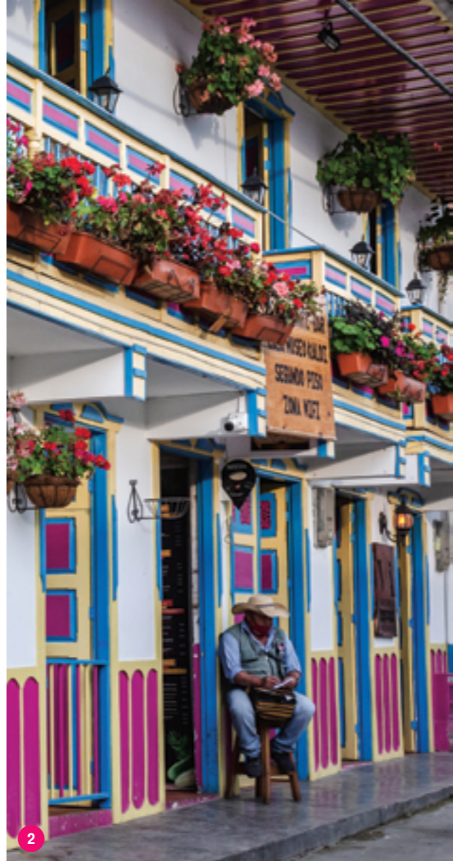
1. Дворик Музея Фернандо Ботеро в Боготе 2. Колоритная улица городка Саленто в Кофейном треугольнике 3. Граффити в квартале Хетсемани в Картахене 4. Суп ахиак с курицей, картофелем и авокадо