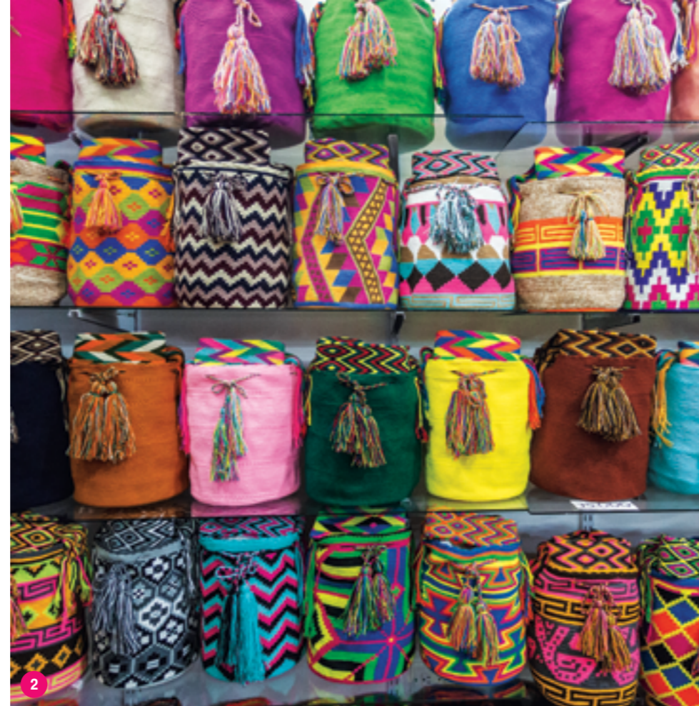
1. Вид на Боготу с панорамной площадки на горе Монсеррат 2. Традиционные вязаные сумки-мочилы 3. Бариста на кофейной плантации San Alberto в Кофейном треугольнике 4. Восковые пальмы в долине Кокора