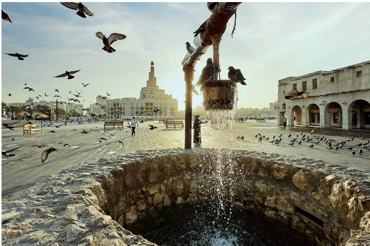
Исламский культурный центр «Бин Заид» примечателен спиральным минаретом

Золотой «Палец» французского скульптора Сезара Бальдаччини сияет в лучах солнца близ рынка Сук-Вакиф, словно гарант успеха будущих сделок. Такой же 12-метровый палец в парижском деловом квартале Дефанс появился еще в 1984 году. А в Дохе скульптура была установлена в 2019-м, когда Катар выиграл право принимать чемпионат мира по футболу.