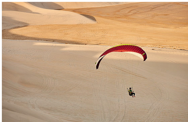
Большую часть полуострова, на котором расположен Катар, занимает пустыня

Культурный кластер Дохи — Katara Cultural Village. Свежие граффити и скульптуры органично смотрятся на фоне голубой мечети и старых голубиных башен. Прихватив стаканчик карака — бедуйского чая с кардамоном и молоком, — надо дойти до амфитеатра, где проводятся все значимые представления, прогуляться вдоль пляжа и на обед остаться здесь же, в Boho Social. От него рукой подать до главного в этом районе молла — Galeries Lafayette с первой в мире кондиционированной улицей. Охлаждающие агрегаты вмонтированы в тротуар, так что прогулка обещает быть комфортной в любую жару. Да, в Катаре на самом деле охлаждают улицы.