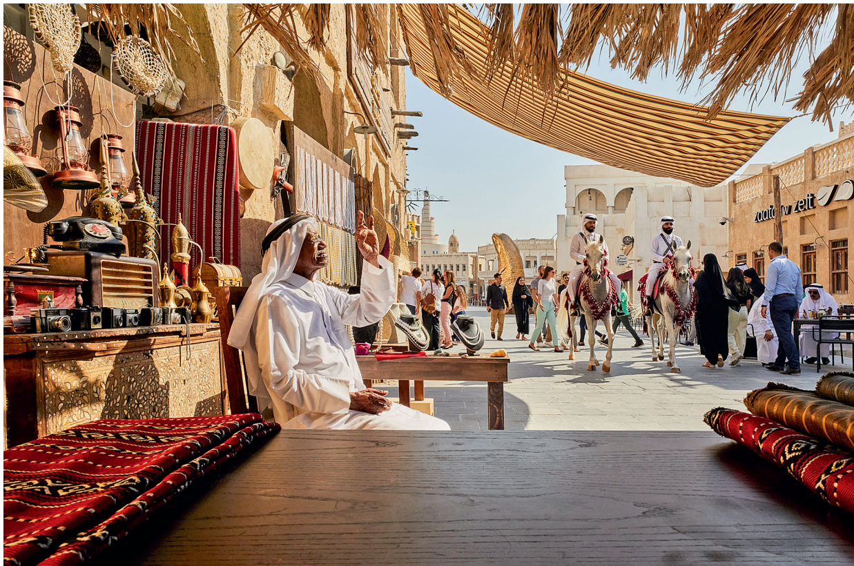
Увеличенная копия большого пальца Сезара Бальдаччини сияет золотом близ рынка Сук-Вакиф

Вечерами на рынке шумно, людно, ароматно. Многие часами сидят в открытых кафе. Столик в ресторанах здесь лучше заказывать заранее; особенно популярны сверкающий кристаллами Parisa, где подают блюда персидской кухни, и сирийский Damasca, где на шаكريе — тушеную баранину со сливками — едва хватает сил после закусок мезе.