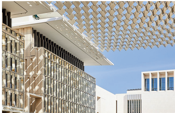
Доха в XXI веке стала подлинным заповедником современной архитектуры

части пустыни, сделав безжизненное пространство платформой для самовыражения.