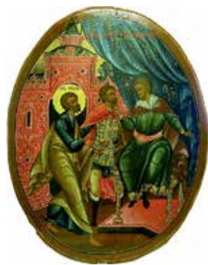
В Государственном музее Палехского искусства собраны тысячи экспонатов – от икон XIV века до шкатулок с агитлаком. Входящий в состав комплекса Музей лаковой миниатюры сейчас на реконструкции, но его коллекция представлена в Музее иконы

А настоящий праздник в честь красочного ремесла проходит в Холуе. Апрельский фестиваль «Русская Венеция» дарит шанс познакомиться с художниками, попробовать уху из городка Южа и понаблюдать за «Потешной флотилией» (2) – расписными лодками, которые ходят по реке Тезе.