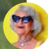
Хелен Винкль @baddiewinkle*

Их зовут гранфлюенсерами – от слов «инфлюенсер», что означает лидер мнений, он же блогер, и «грэнни» – бабушка. Они вышли на пенсию и стали знамениты. На них подписаны миллионы человек во многих странах. Они рассказывают о принятии своего возраста, делятся рецептами и ценными советами об отношениях, учат одеваться, эпатируют, веселят и даже стримят – ведут прямые эфиры в своих социальных сетях. Их объединяет одно: все они начали вести свои каналы, когда им было уже довольно много лет. Рассказываем про 10 блогеров, которым глубоко за 60.