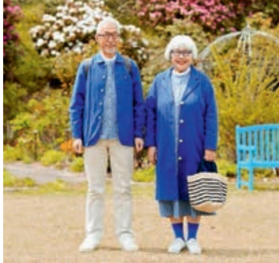
Обычная любовь и близость день за днем – об этом аккаунт пожилой семейной пары из Японии. Вот уже более 40 лет они вместе