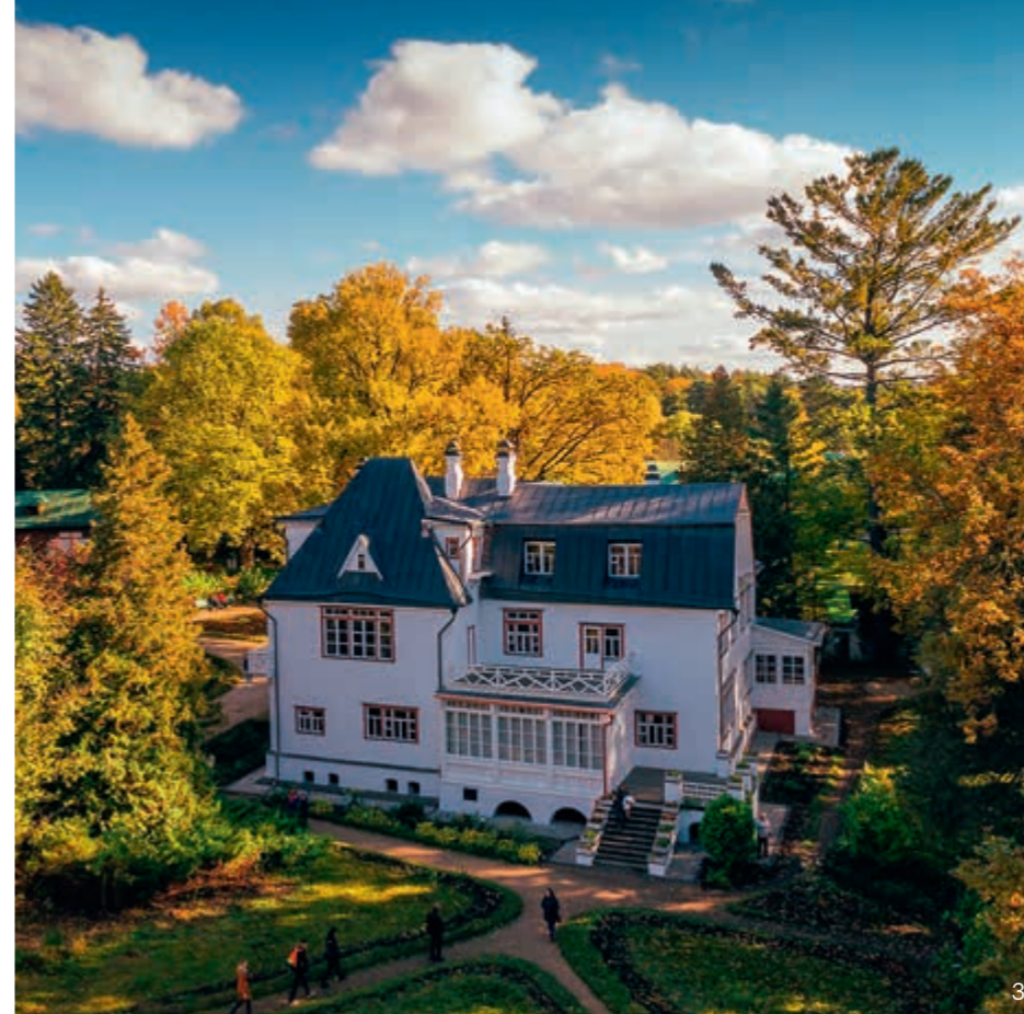
3 Западный фасад Большого дома в Поленово