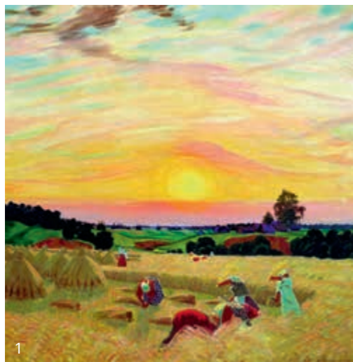
1 Б. М. Кустодиев. «Жатва», 1914