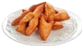
БЛАГОДАРИМ ЗА ПОМОЩЬ В ПОДГОТОВКЕ МАТЕРИАЛА ПРОЕКТ «МЕДИАРАЗВЕДКА» СЕРВИСА ПУТЕШЕСТВИЙ «ТУТУ».

! БОРЦОГ – ЛЮБИМОЕ ЛАКОМСТВО КАЛМЫКОВ, КОТОРОЕ ПО ВКУСУ НАПОМИНАЕТ НЕСЛАДКИЕ ПОНЧИКИ. ЕГО ГОТОВЯТ ИЗ ПШЕНИЧНОЙ МУКИ И ЖАРЯТ В БАРАНЬЕМ ЖИРЕ. ОСОБОЕ ВНИМАНИЕ УДЕЛЯЮТ ФОРМАМ: ИХ БОЛЕЕ ДЕСЯТКА, И КАЖДАЯ ИМЕЕТ СВОЕ СИМВОЛИЧЕСКОЕ ЗНАЧЕНИЕ.