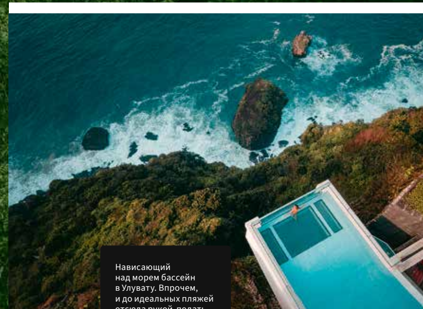
Нависающий над морем бассейн в Улувату. Впрочем, и до идеальных пляжей отсюда рукой подать