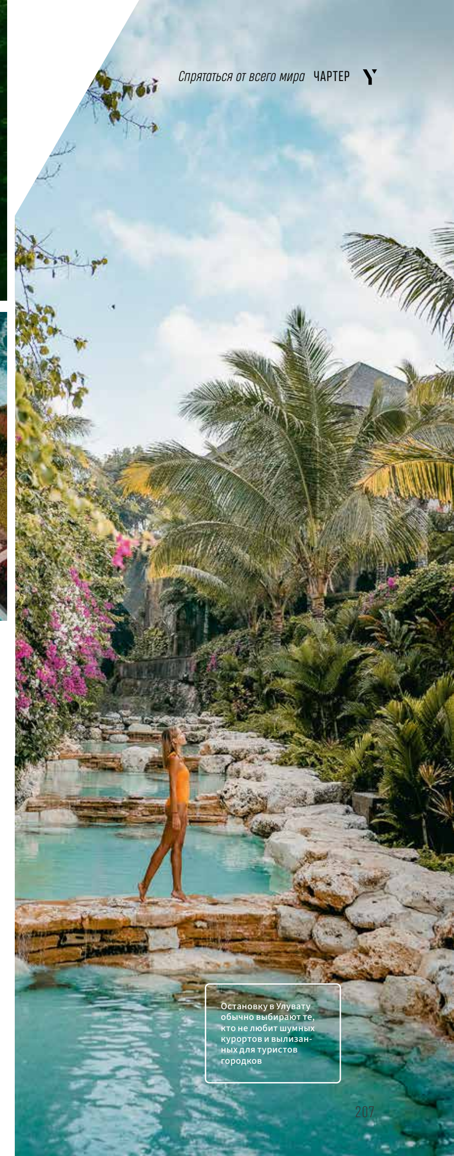
Остановку в Улувату обычно выбирают те, кто не любит шумных курортов и вылизанных для туристов городков

ктически любое жилье. Остаться можно в Убуде, если захочется стать мирным селянином. Там десятки йога-центров, предлагающих ментальные практики — от саундхилинга до гонг-медитаций; спа-центров, где убажуют тело; бутиков, где продают одежду экспаты; художественных галерей; проложено несколько крутых веломаршрутов. Неподалеку можно закупиться светильниками, кашпо, шкатулками, мебелью из ротанга и добавить интерьеру дома или яхты стиля бохо. По дороге на Тегаллаланг и в деревне Мас ремесленники предлагают товары по бросовым ценам. В веселом Семиньяке удобно остановиться тем, кто любит быть в курсе всего происходящего: здесь много ресторанов и клубов, бутиков и магазинов. В Чангу проще найти единомышленников по самопознанию и различным практикам, в Улувату понравится интровертам: вдали от шумных Куты и Денпасара или вылизанной для туристов Нуса-Дуа тихо и до идеальных пляжей совсем близко. За всей этой островной жизнью важно уловить момент, когда настанет пора поднимать якорь. Впрочем, духи острова подскажут и дадут знак.