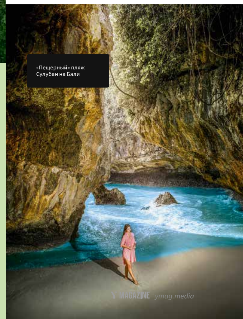
«Пещерный» пляж Сулубан на Бали