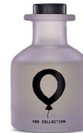
Диффузор и свеча 369 COLLECTION