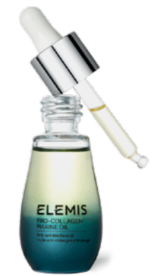
Масло для лица и маска для век «Про-Коллаген» Elemis

Зимой наша кожа нуждается в качественном увлажнении, ведь именно сухость и раздражение усугубляют проявление возрастных и мимических морщин. На помощь могут прийти средства от британского бренда Elemis. Добавьте в свой уход масло для лица «Про-Коллаген» с гидратами морских водорослей и ценными эфирными маслами, которое интенсивно питает и, по заявлению производителя, восстанавливает упругость и эластичность кожи. Другой бестселлер бренда — пробуждающая маска для век «Про-Коллаген» со снежными водорослями: она увлажняет нежную кожу вокруг глаз без утяжеления, уменьшает видимые признаки усталости и дарит приятное ощущение прохлады.